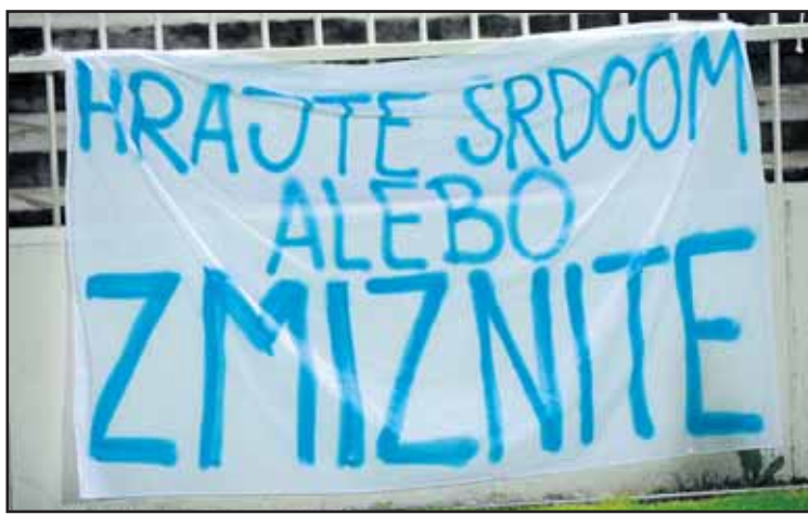
Slovanisti svojich fanúšikov nepotešili ani v Prešove.