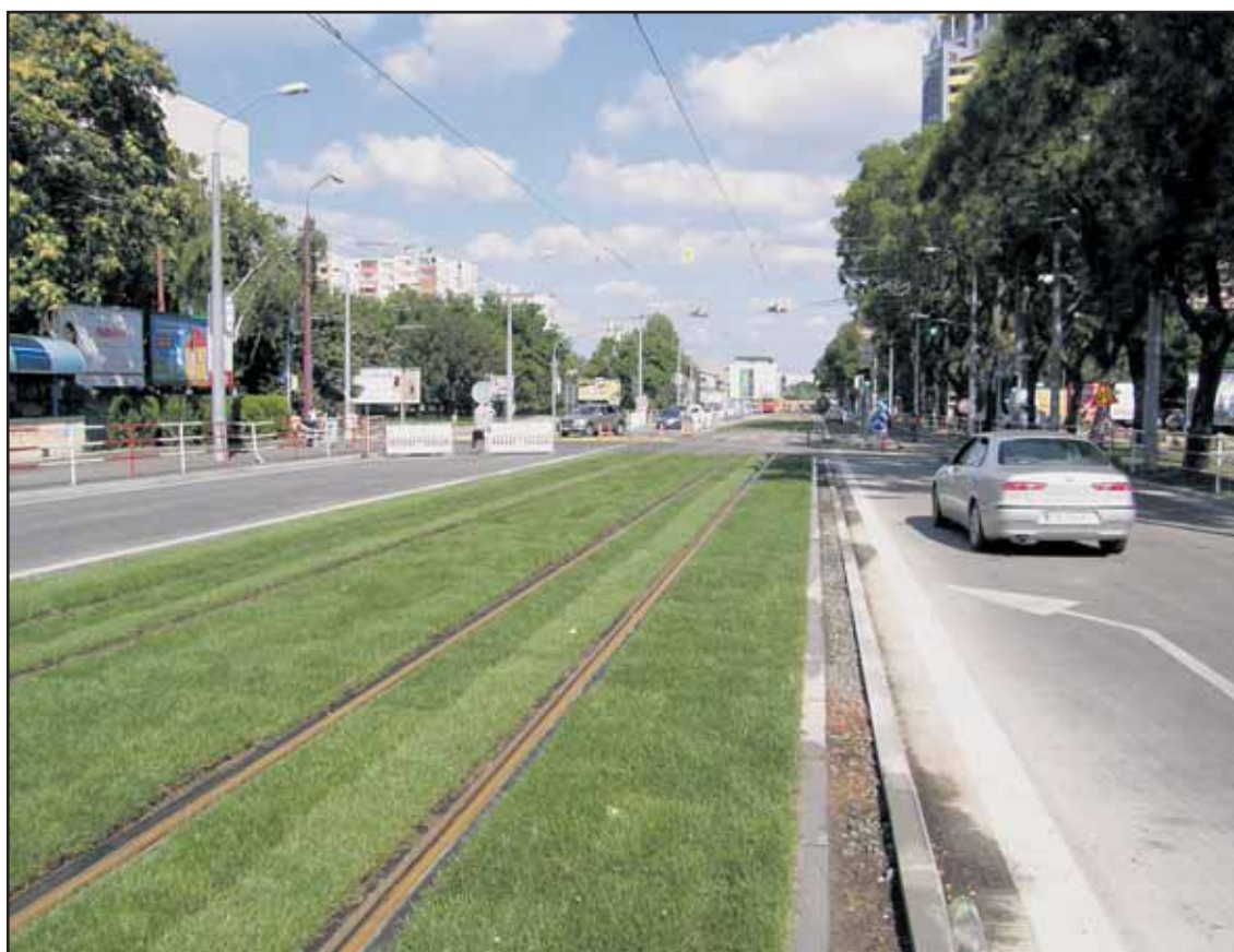
Nový trávnik na električkovej trati osvieži celú cestu do Ružinova.

Pozor, súťažime len 3 dni - od pondelka 31. augusta do stredy 2. septembra 2009. Kliknite na www.banoviny.sk a choďte na koncert Anastacia! (red)