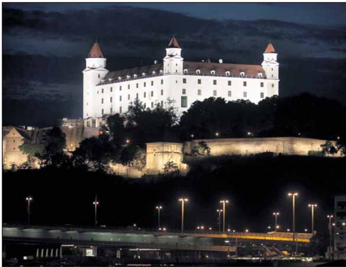
Hrad dnes žiari a vidieť ho už zo vzdialenosti niekoľkých kilometrov.

Kto nebude mať šťastie v súťaži Bratislavských novín, môže si lístky na AND1 Basketball Mixtape Tour 2009 kúpiť v sieti Ticketportal. (red)