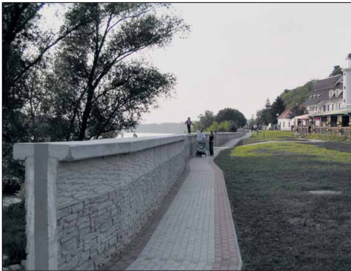
Protipovodňový múrik v Devíne skrášil okolie pri osobnom prístavisku.

Dopravný podnik ponúkol na utorok 22. septembra 2009 mestskú hromadnú dopravu zadarmo, v ten istý deň by mali zamestnanci veľkých bratislavských firiem cestovať do práce iným dopravným prostriedkom ako autom. Okrem toho sa Viedenská cesta od 10.00 do 20.00 h zmení na veľké športovisko, kde budú súťaže na kolobežkách, šprint na inline korčuľoch, inline exhibícia, požičovňa originálnych bicyklov, bežecká míľa, súťaže a ihriská pre deti, špeciálny program pre rodičov s kočíkmi. Kto príde v tento deň na Viedenskú cestu inak ako autom a vyplní anketový lístok, bude zaradený do zlosovania o hlavnú cenu - let balónom nad Bratislavou, voľné lístky na MHD, vstupenky na hokej HC Slovan, voľné vstupy na plaváren Pasienky a ďalšie atraktívne ceny. Večer bude ešte jazda Bratislavou na kolieskových korčuľoch a bicykloch so štartom o 21.00 h pri divadle Aréna. (brn)