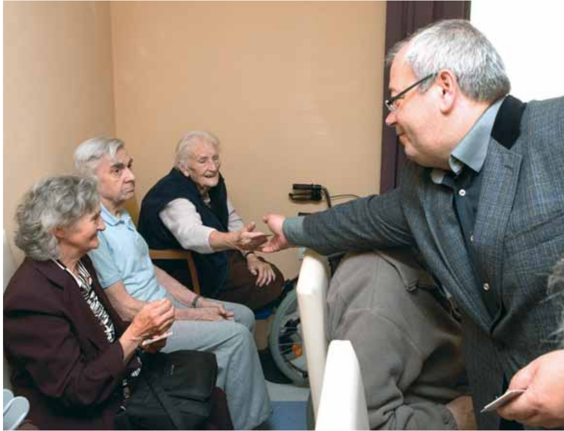
V sociálnom zariadení Náruč záchranu na Fedákovej ulici v Dúbravke vysvätili pred niekoľkými dňami Krížku Sv. kríža. Témou slávnosti vysvätenia bol symbol kríža a kresťanské motto – Len ten človek, ktorý prijme kríž, je veľký.

Jeden z kandidátov na župana tvrdí, že je smutné, ak sa činnosť župy zredukuje len na úradovanie a vydávanie povolení. Aj my sme podľa neho len vymyslení?