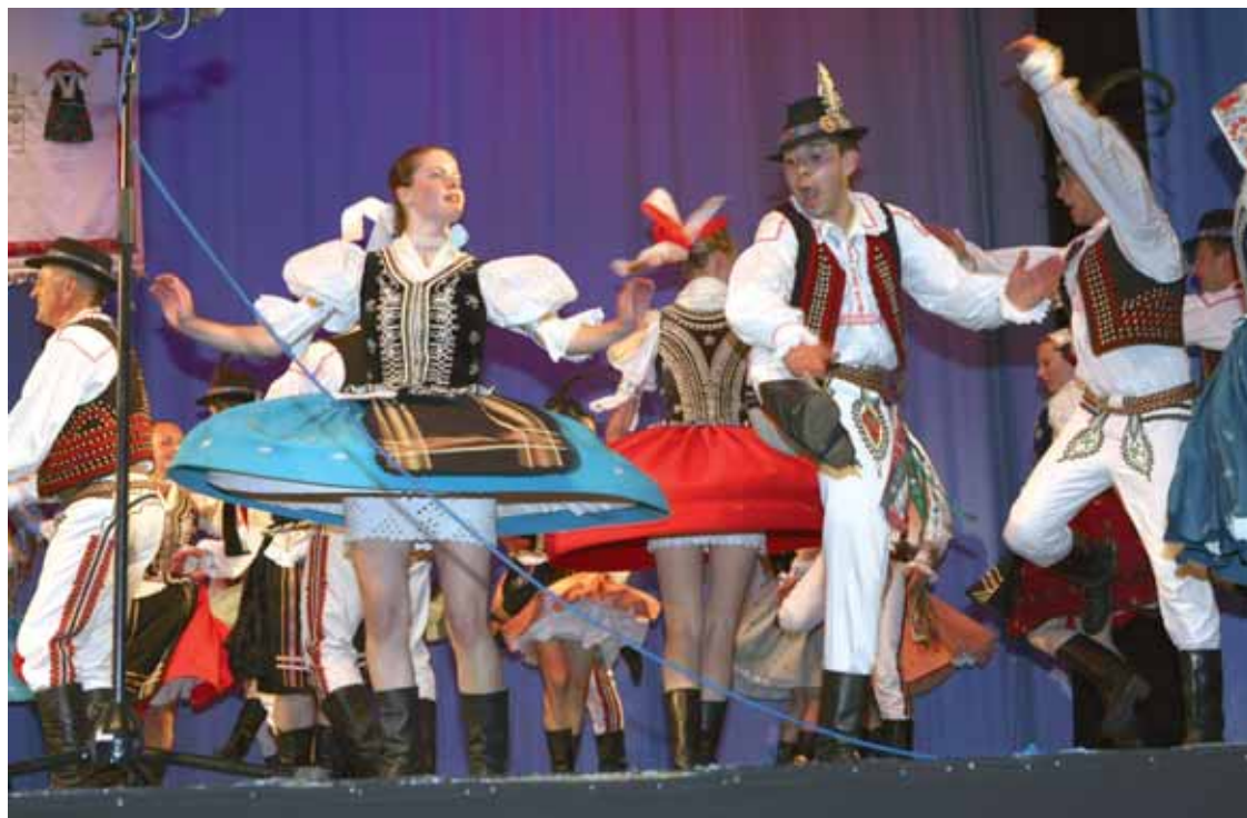
Večer autentického folklóru v DK Zrkadlový háj objektívom Františka Rajeckého.