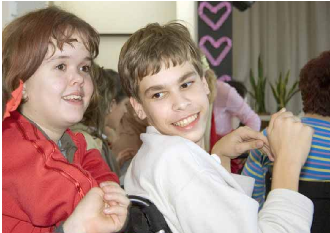
Klienti z Mokrohájskej sú vďační za každú návštevu.