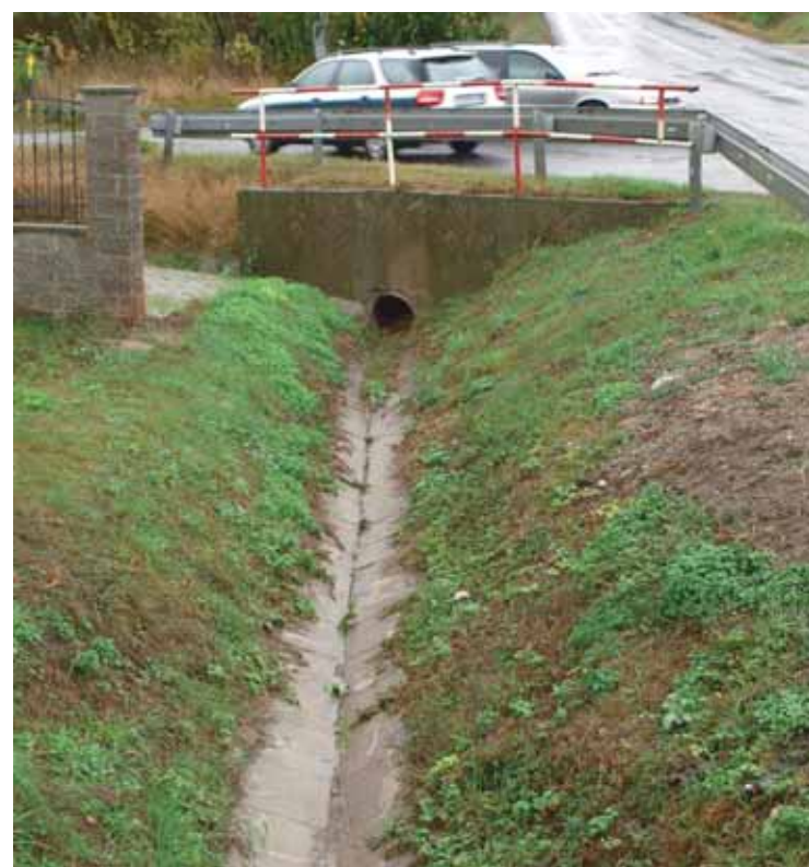
Vyčistené priekopy držia vodu na uzde.

do dvorov, záhrad. „BSK sa tento rok dohodol s Regionálnou správou ciest, že sa vyčistí 3 km kanálov po oboch stranách cesty. Prví to platili, druhí robili. Stálo to vyše milióna korún. Niektoré úseky takmer splyvali s cestou, čo boli tak zanesené bahnom, kadejakým odpadom, zarastené chumáčmi trávy. Cestu sme rozšírili vari o meter, keď sa vyčistili krajnice z oboch strán. Obci to veľmi pomohlo, veď ide aj o protipovodňové opatrenia. Rozšírením a vyčistením komunikácii sa zvýšila bez-