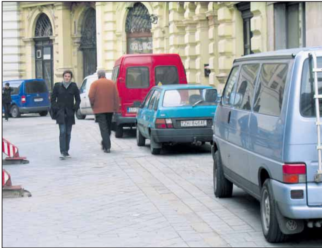
Na Laurinskej ulici denne protiprávne parkujú autá robotníkov z celého Slovenska.

BRATISLAVA Úrad pre verejné obstarávanie (ÚVO) nariadil zrušiť nákup nových autobusov Irisbus Citelis 12M. Tie v lete kúpil Dopravný podnik Bratislava, a.s., po tzv. rokovacom konaní. Dopravca sa preto obrátil na súd. Mestský dopravca v septembri slávnostne odovzdal do užívania 35 nových nízkopodlažných dvanásťmetrových autobusov Irisbus Citelis. Ich celková cena bola 7 546 210 eur bez DPH. Helena Fialová potvrdila, že úrad po kontrole tzv. rokovacieho konania bez zverejnenia na nákup autobusov toto rokovacie konanie nariadil zrušiť. Podľa úradu nebola splnená podmienka na použitie rokovacieho konania bez zverejnenia. Dopravný podnik podal proti tomuto rozhodnutiu úradu žalobu. Bratislavský dopravný podnik v oznámení o výsledku rokovacieho konania bez zverejnenia uviedol v Európskom vestníku dôvod tejto formy obstarania. Umožnilo mu to ustanovenie zákona o verejnom obstarávaní, v tomto prípade malo ísť o obstaranie tovaru za mimoriadne výhodnú cenu, ktorá je nižšia ako trhovacia cena a je ponúkaná len v určitom a krátkom časovom období. Podľa vyjadrenia dopravného podniku spoločnosť mimoriadne výhodnou cenou ušetrila 665 000 eur, keďže získala osempercentnú zľavu. Výhodou bolo aj to, že dopravca nemusel čakať na dodáciu lehotu, ktorá obyčajne trvá šesť až deväť mesiacov. (rob)