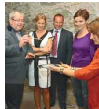
Krst knihy My a náš svet . Práce klientov DSS Rosa.

Vlni sme dostali od ministerstva práce, sociálnych vecí a rodiny dotácie vo výške 4 045-tis. Sk na sedem predložených projektov. Projekty boli 10 % spoluúčasťou dofinancované z prostriedkov BSK. Vďaka tomu sme mohli zvýšiť kvalitu hipoterapie a hiporehabilitácie, zlepšiť manipuláciu s imobilnými a ťažko mobilnými klientmi nákupom sprchovacích vozíkov a inštaláciou schodiskovej plošiny, nákupom audiovizuálnej techniky pre skupinovú prácu podporiť sociálne zručnosti našich klientov, nákupom špeciálnych hudobných nástrojov pre ťažko postihnuté deti a vybavením miestnosti na muzikoterapiu podporiť liečbu muzikoterapiou, nákupom zdvíhačkov zlepšiť manipuláciu s imobilnými a ťažko mobilnými klientmi na lôžkovom oddelení, nákupom nových postelí a nočných stolíkov zvýšiť úroveň komfortu klientov, či skvalitniť život relaxačno-športovými aktivitami nákupom športových potrieb a úpravou areálu.