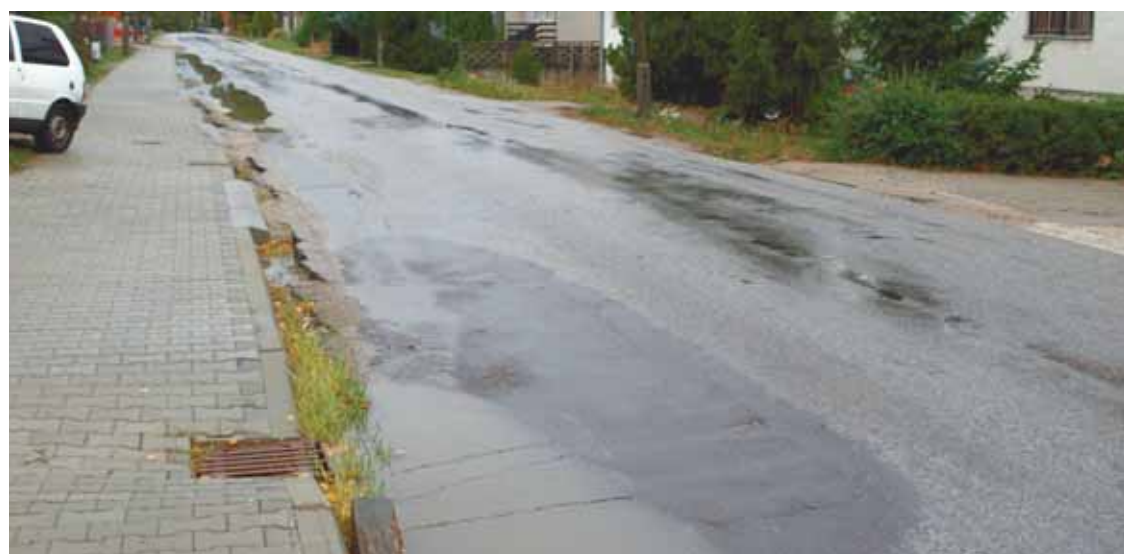
Po oprave chodníkov je rad na ceste.

Už aby prišla budúročná jar. Ale to už je pranie nielen budmerického starostu.