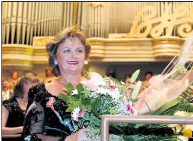
Hviezdou festivalu bude aj Edita Gruberová.

Na BHS bude účinkovať aj Symfonický orchester z Norrköpingu zo Švédska a fínsky orchester z Lahti. Na 45. ročníku BHS sú na programe 3 klavírne