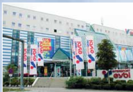
2331 Vösendorf, križovatka ulíc Triester/Altmannsd. Str.