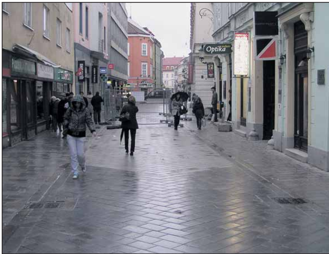
Po novej dlažbe sa začalo chodiť tento týždeň, zásobovanie môže jazdiť od pondelka.

Internetovú anketu sme ukončili predčasne po tom, ako nás niektorí čitatelia upozornili, že v hlasovaní dochádza pravdepodobne k manipulácii. Napriek tomu, že hlasovanie bolo obmedzené pre každú IP adresu iba raz, dochádzalo najmä v noci k výraznému nárastu hlasov. Zostáva veriť, že tie sobotné voľby nebude manipulovať nikto. (pol)