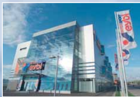
1210 Viedeň, Seyringerstr./na úrovni Wagramer Str.

Volebný obvod 4, kandidát na poslanca za mestskú časť Bratislava - Nové Mesto