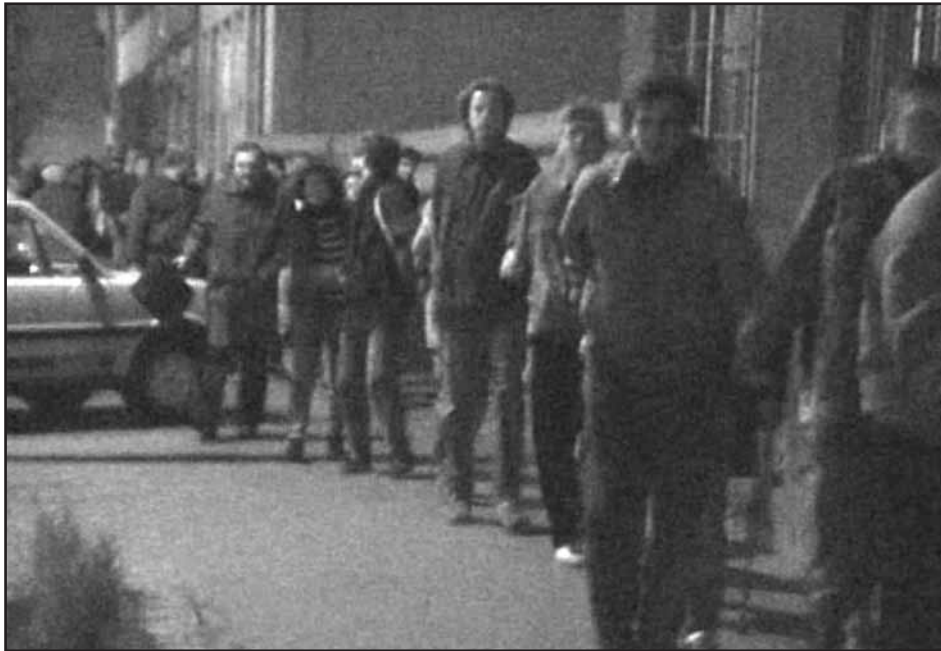
Bratislavskí vysokoškoláci sa 16. novembra 1989 na Mierovom námestí pochytili za ruky a vydali sa na pochod mestom až na Suvorovovu ulicu pred budovu ministerstva školstva,...

~ ~ ~ Záznam pochodu zo 16. novembra 1989 je so súhlasom STV zverejnený na www.banoviny.sk