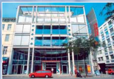
1150 Viedeň, „vonkajšia strana“ Mariahilfer Str., 138