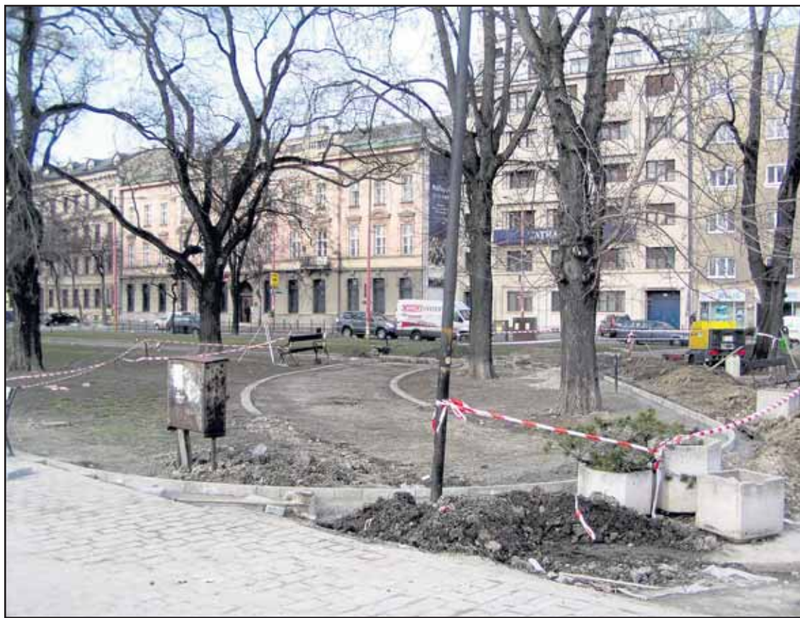
Park dnes pripomína stavenisko, na jar by už mal znovu lákať na prechádzky.

Kliknite na www.banoviny.sk a zapojte sa do súťaže o voľné lístky na niektorý z trojice sviatočných koncertov. Súťažime do nedele 20. decembra 2009, mená výhercov vyžrebujeme v pondelok ráno. O spôsobe prevzatia výhry budú traja šťastlivci informovaní e-mailom. (red)