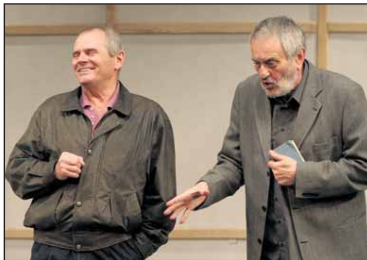
Milan Kňažko (vľavo) a Milan Lasic.