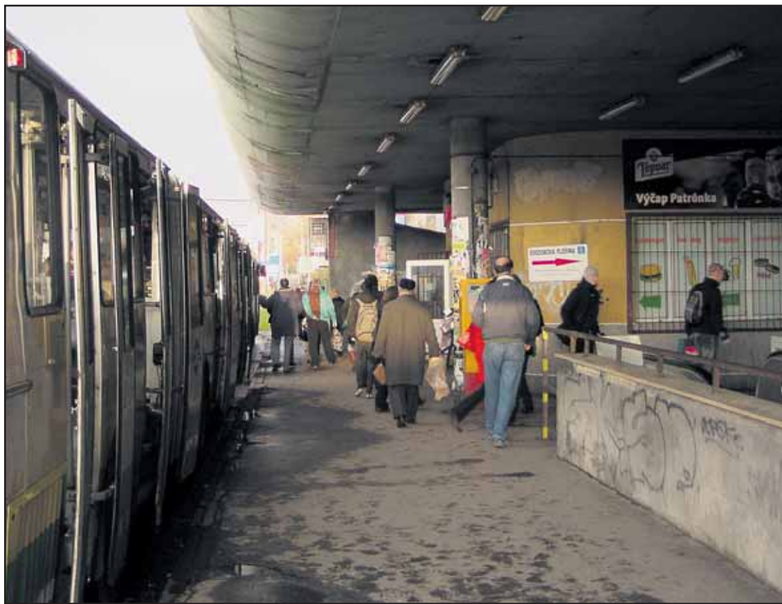
Zastávky na Patrónke sú v dezolátnom stave, staré a zničené.

Projekt visutých záhrad ponúka verejný priestor zelene, kultúry a oddychu v prostredí viacerých terasovitých záhrad vysunutých nad Bratislavou s jedinečnými panoramatickými pohľadmi. Ich súčasťou by mali byť čiastočne zapustené objekty so zelenými strechami predstavujúce technické a kultúrno-spoločenské zázemie mestského parku. (red, rob)