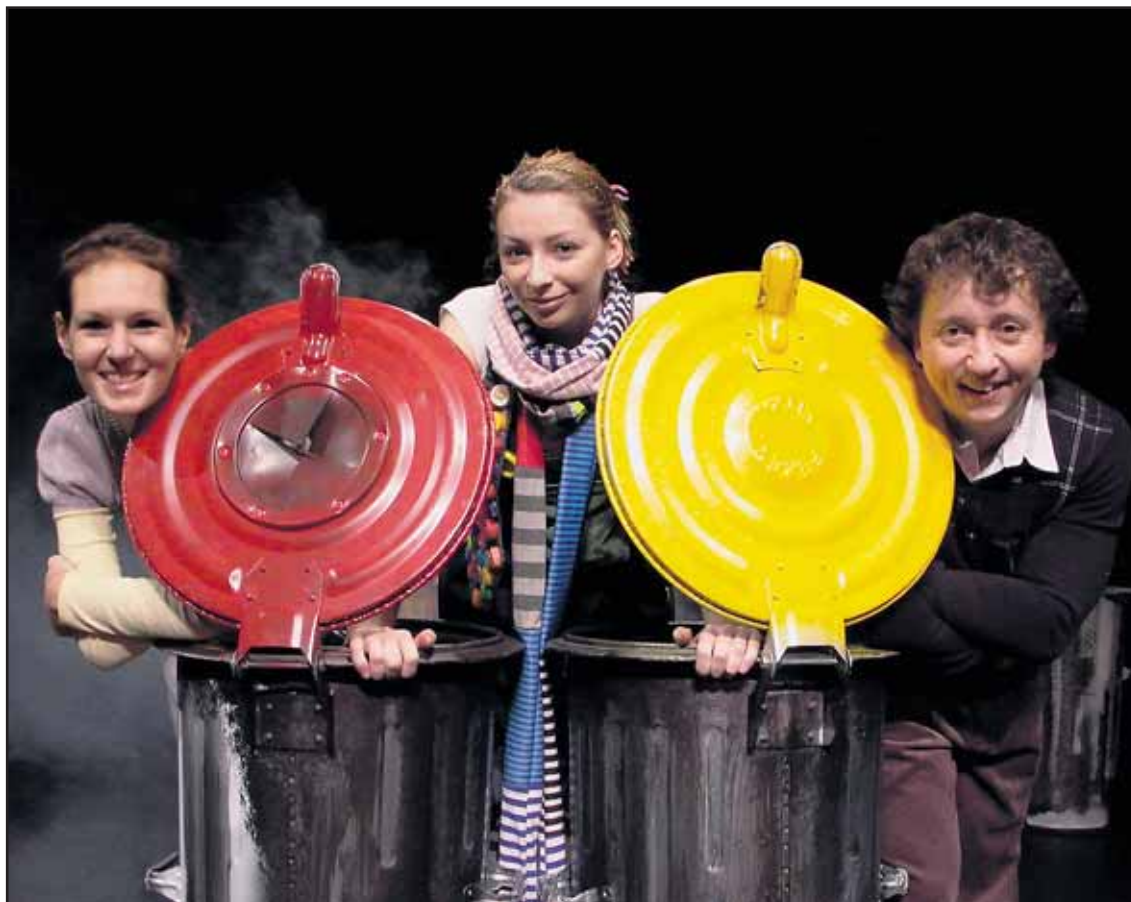
Pipi vie stále očariť nielen deti, ale aj ich rodičov.

Viac o bratislavskej kultúre sa dozviete na www.banoviny.sk