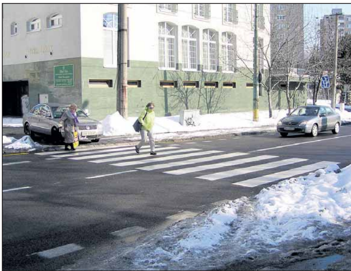
Neuveriteľnú drzosť mal na Stromovej vodič vchádzajúci na cestu cez priechod!

Napriek tomu bude v meste päť plesov aj po Popolcovej strede. Zoznam podujatí Plesovej sezóny 2010 nájdete na www.bratislavskenoviny.sk. (red)