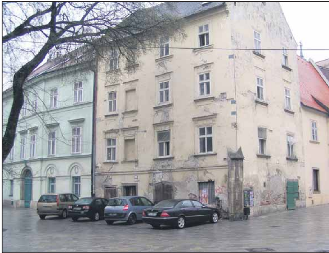
Investor nevie, čo s domami na Františkánskom námestí. Preto vyhlásil súťaž!

Súhlasíte s výstavbou megakasína Metropolis v Bratislave? Zapojte sa do ankety na www.banoviny.sk, hlasovanie potrvá ešte týždeň. Hlasovať z jedného počítača je možné iba raz. (ado)