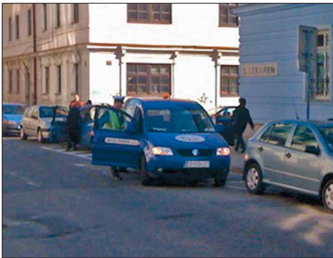
Policajti si po založení papuče na Cintorínskej ulici sadá do vozidla súkromnej firmy.

Podrobný program víkendového podujatia Bratislava pre všetkých nájdete na www.bratislavskenoviny.sk. (brn)