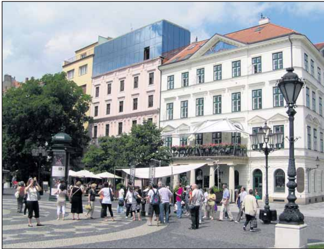
Presklená fasáda vyzerá ako z iného sveta, na námestie sa určite nehodí!

Keďže je možné, že mestskí poslanci budú chcieť rozhodnúť o budúcom využití Starej tržnice ešte pred koncom volebného obdobia, radi by sme predtým spoznali názory čitateľov Bratislavských novín. Rozhodli sme sa ich na to spýtať prostredníctvom internetovej ankety. Aké by teda malo byť ďalšie využitie Starej tržnice? Obnoviť trhovisko, kultúrne zariadenie alebo obchodná galéria? Hlasujte na www.banoviny.sk , hlasovať je možné z jedného počítača vždy iba raz. (red)