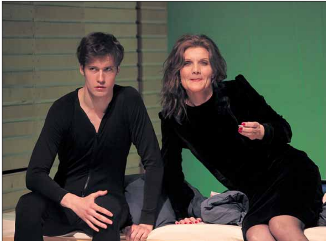
Príbeh lásky staršej ženy a mladého chlapca určite nie je romantickou komédiou.

„Každá pesnička má svoje čaro aj preto, lebo tam nehrá len tých päť chalanov z MIG-u, ale aj tridsaťčlenný band. Pôvodne sme chceli, aby to znelo ako dychocka, ale nejako nám z toho vylietol swing. Je to vlastne taký guláš, ťažko sa o tom hovorí. Skôr by som odporúčal prísť si to vypočuť,“ komentuje projekt Jiří Macháček. (dš)