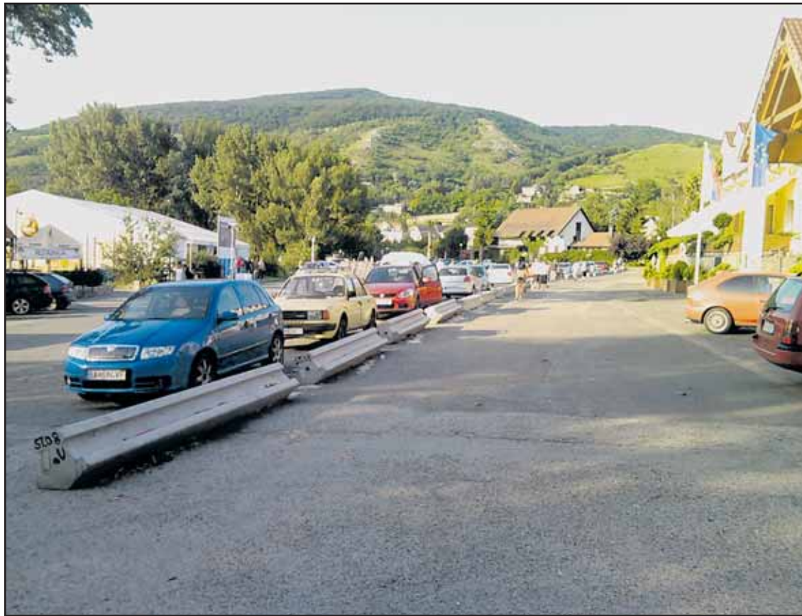
Parkovisko pod Devínskym hradom robí hanbu, je rozdelené na dve časti.

Kupca našla mestská časť vo verejnej obchodnej súťaži, na ktorej sa zúčastnili štyria záujemcovia. Podmienky súťaže splnili dvaja, najvyššiu ponuku predložila spoločnosť Schöndorf, s.r.o. Mestská časť predala R.B.I. za 5,17 milióna €, s piatimi budovami však predala aj dlh vo výške 6,96 milióna €, ktorý bude spoločnosť splácať do apríla 2031. S dlhom voči mestskej časti vo výške 516 tisíc € tak dosiahla predajná cena 12,64 milióna € (380 miliónov Sk). (brn)