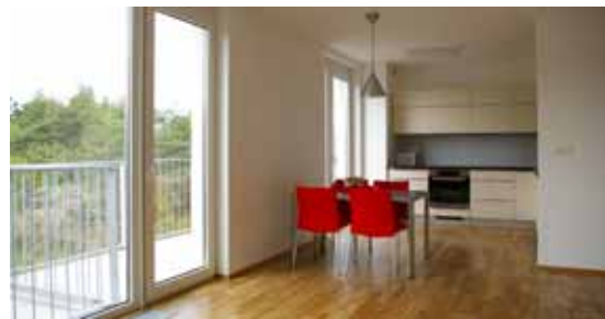
Posledné voľné byty v I. etape