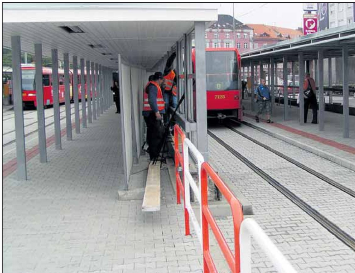
Električky už jazdili, ale na Trnavskom mýte sa ešte dokončievali rekonštrukčné práce.

Cez tunel v smere do Karlovej Vsi a Dúbravky a opačným smerom, premávajú linky 1, 5 a 9. Do tunela v smere z Karlovej Vsi neodbočujú linky 4, 17 a 12, ktoré jazdia cez centrum v okolí Jesenského ul. a Šafárikovho námestia. Od 2. septembra vznikla zlúčená zastávka za križovatkou Radlinského-Vazovova pre linky číslo 2, 3, 5, 7/17, 8, 9 a 11 na smery Hlavná stanica, Dúbravka, Námestie SNP, Karlova Ves a Námestie L. Štúra. Dopravca rozšíril aj obsluhu zastávky Nevádzová na Tomášikovej ulici. Obnovená bola aj premávka na linkách 7, 17, 55, 178 a 192 a na linkách školskej dopravy. (rob)