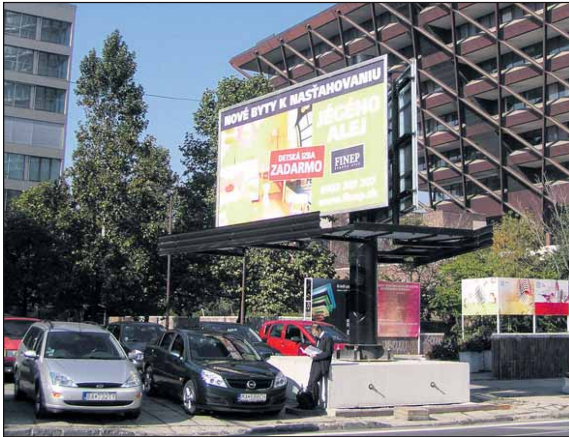
Bigboard pred rozhlasovou pyramídou bol postavený načierno, bez povolenia.