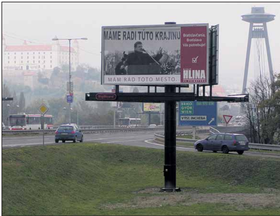
Petržalka je plná bilbordov, najnovšie ich pribudlo hneď štrnásť.

Od roku 2010 prichádza dopravca s novšou čipovou kartou na vyššej technologickej úrovni a s lepším ochranným zabezpečením. Navyše vzniká aj mestská karta, ktorá bude tiež slúžiť ako električenka. Zákazník si však môže kúpiť osobitne aj čipovú kartu, len ako predplatený cestovný lístok do MHD. (rob)