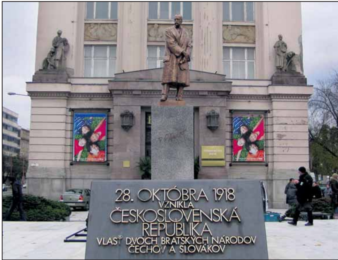
Pamätník československej štátnosti dotvorila socha T. G. Masaryka.