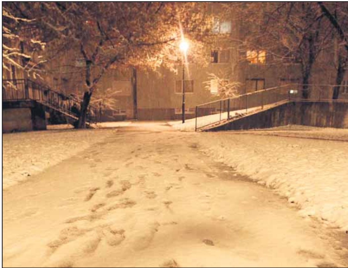
Zasnežená Bratislava vyzerá pekne. Škoda, že sneh zatiaľ dlho nevydržal.

Zoznam všetkých bratislavských plesov a bálav opäť zverejníme na webstránke www.bratislavskenoviny.sk , kde môžu organizátori bezplatne pridať svoje podujatie plesovej sezóny. Plesová sezóna sa tradične zhoduje s obdobím fašiangov, ktoré sa začínajú hneď po Troch kráľoch a trvajú do Popolcovej stredy, ktorá bude na budúci rok až 9. marca 2011. Plesová sezóna teda potrvá až dva mesiace! (ado)