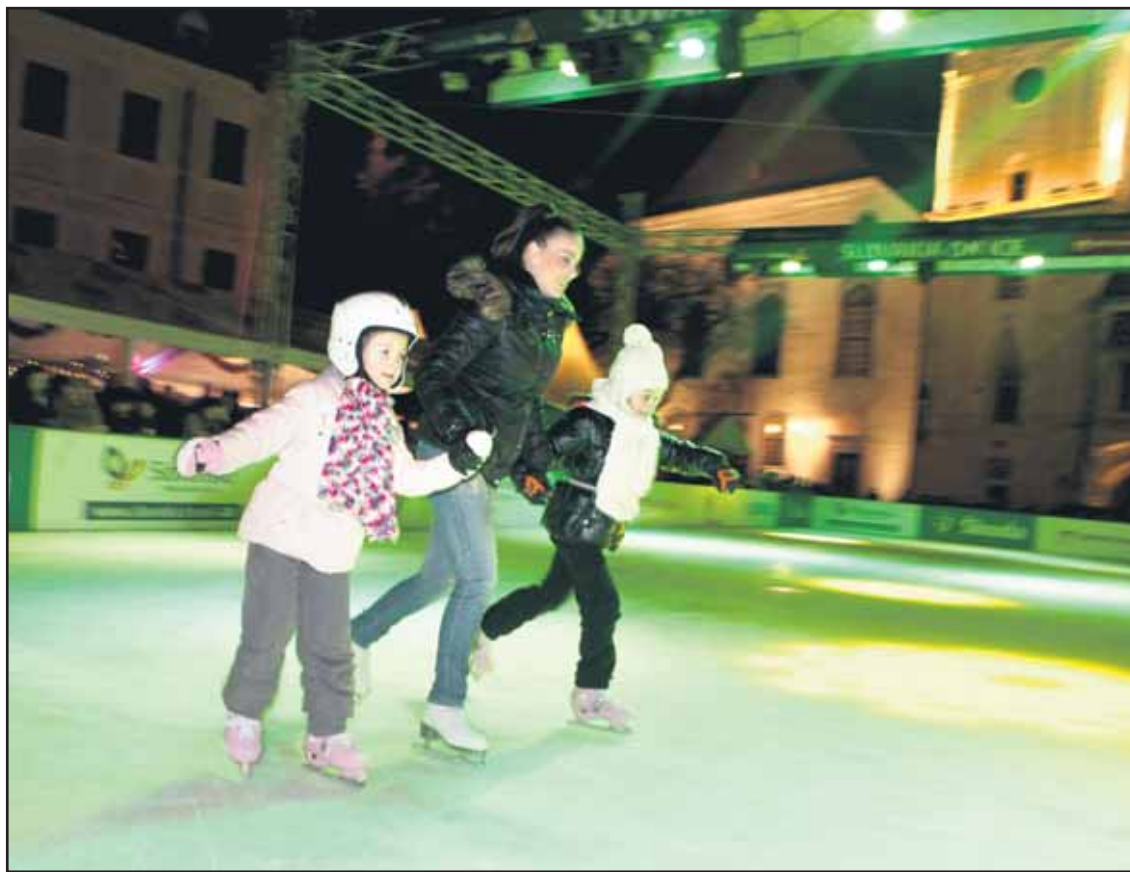
Klisko v strede mesta je lákadlom najmä popoludní a večer.

■ piatok 11. 2. 2011 a sobota 12. 2. 2011: Podunajské Biskupice, Vrakuňa, Vajnory, Dúbravka, Petržalka. (brn) Prehľad termínov zápisu do bratislavských základných škôl (obecných, cirkevných aj súkromných) je zverejnený na www.banoviny.sk