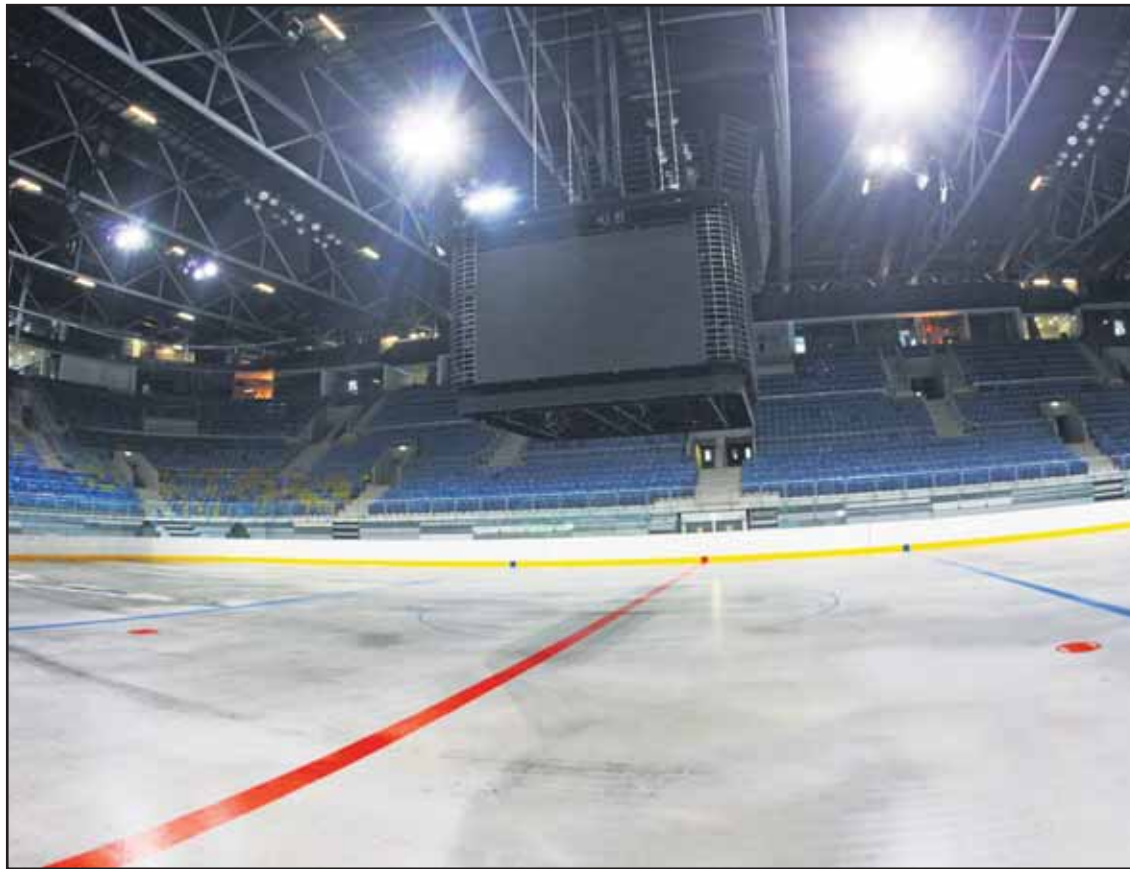
Už budúci týždeň by sa na rekonštruovanom štadióne mal hrať hokej.