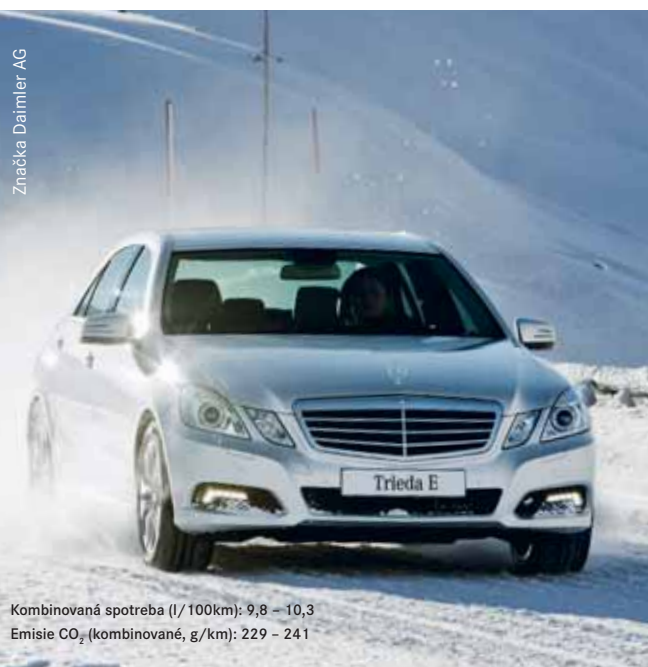
Kombinovaná spotreba (l/100km): 9,8 - 10,3 Emisie CO 2 (kombinované, g/km): 229 - 241

Motor-Car Bratislava, s.r.o. Tuhovská 5, Tel.: 02-4929 4555, E-mail: info@mercedes-benz.sk ; Motor-Car Bratislava, s.r.o. Hodonínska 7, Tel.: 02-4929 4399, E-mail: lamac@motor-car.sk Motor-Car Bratislava, s.r.o. Panónska cesta 31, Tel.: 02-6829 4111, E-mail: panonska@motor-car.sk