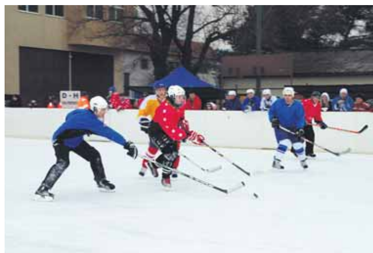
Počas víkendov sa na vajnorskom klzisku konal už 2. ročník turnaja v ľadovom hokeji o Vajnorský ľadový pohár.