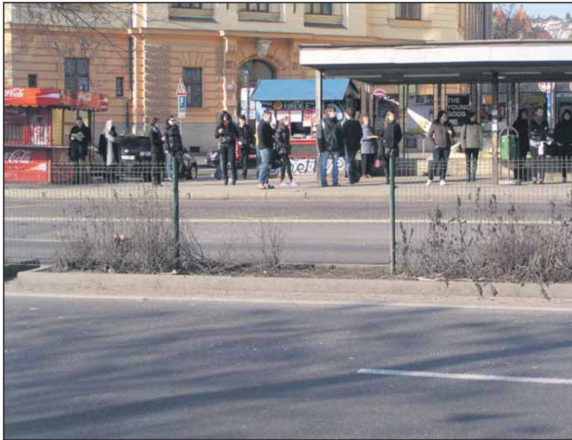
Celé zábradlie na Staromestskej ulici vydržalo veľmi krátko, znovu je poškodené.

O znížení platov a odmien primátorov a starostov bude v marci rokovať aj Národná rada SR. (brn)