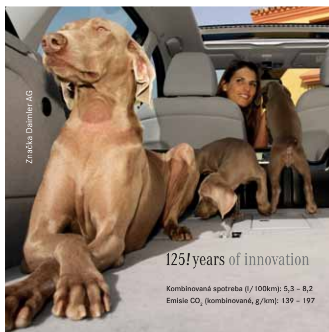
Značka Daimler AG

Bratislavské Noviny vyjdú opäť o týždeň 24. februára 2011