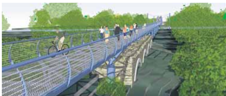
Cyklomost bude určený iba pre peších a cyklistov, ale mal by byť usposobený aj na to, aby cezeň v prípade potreby mohli prejsť aj záchranári.