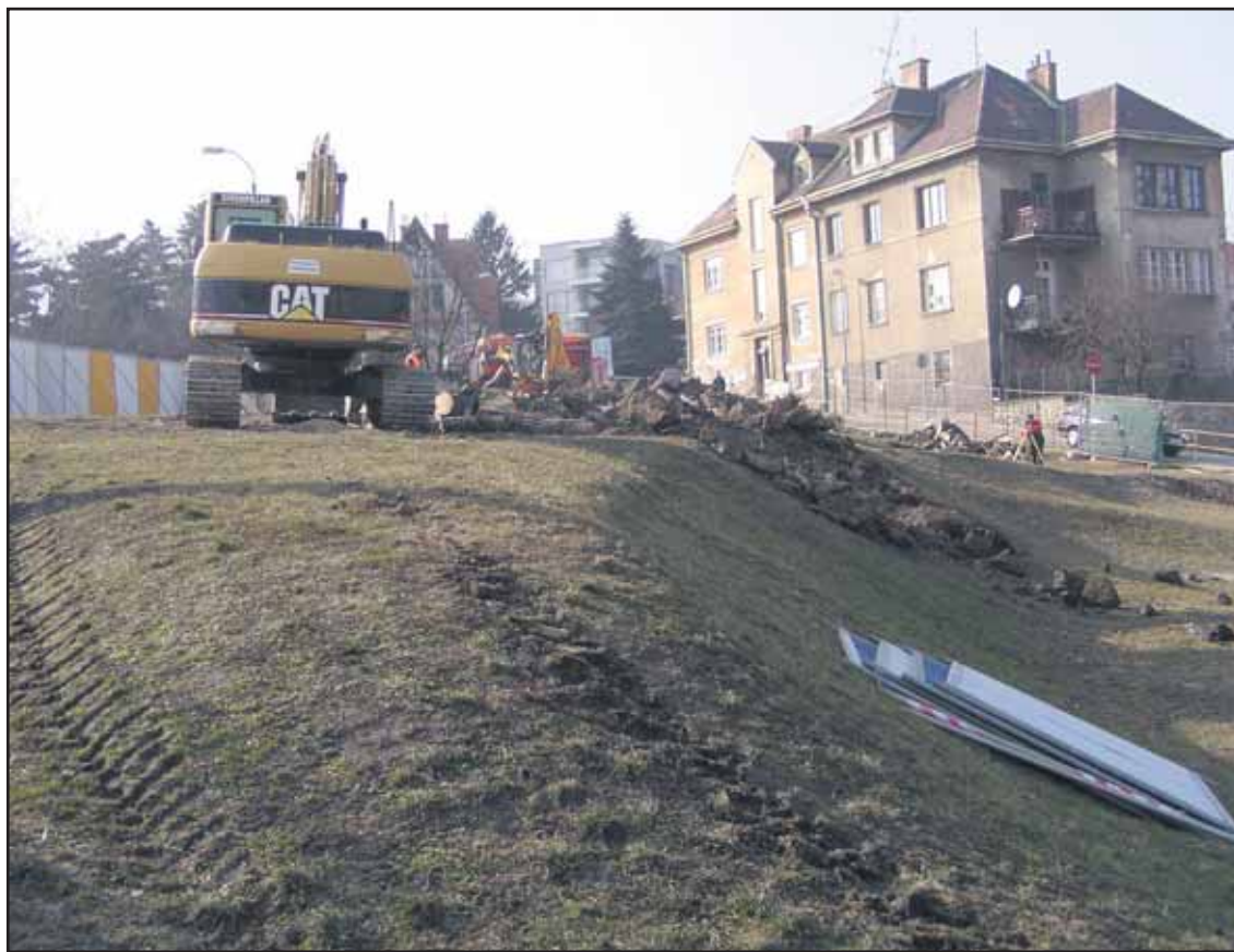
Parčík na Streleckej ulici sa postupne mení na väčšie stavenisko.

Potvrďuje to oznam na webstránke mesta, kde magistrát krátko pred termínom podania žiadostí zmenil požiadavku na vzdelanie. Pôvodne bolo podmienkou vysokoškolské vzdelanie 3. stupňa, po niekoľkých dňoch ho zmierlili a zmenili na vysokoškolské vzdelanie 2. stupňa (3. stupeň výhodou). Postup magistrátu je sporný, pretože ide o zmenu pravidiel počas súťaže, čo by mohlo niektorých uchádzačov zvýhodňovať. Termín podania žiadostí uchádzačov je 3. marca 2011 (brn)