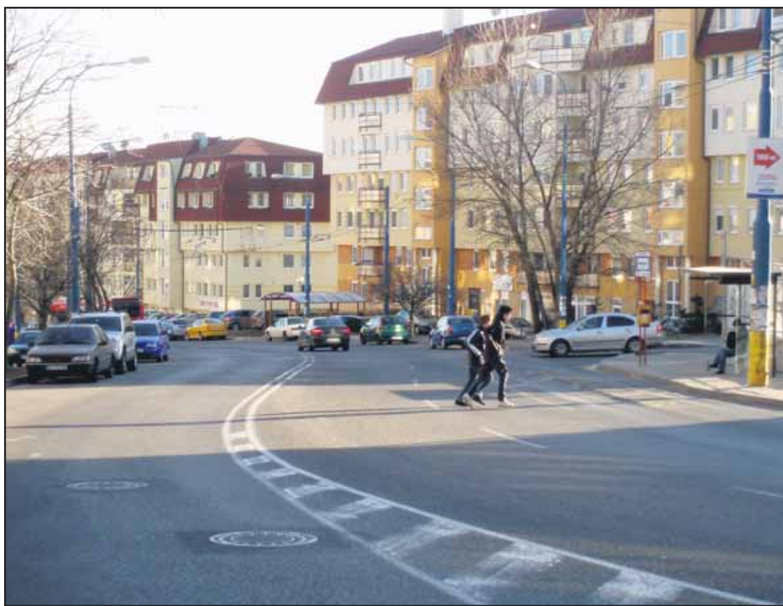
Ľudia chodia na zastávku križom cez cestu, stále hrozí nejaká kolízia.

Dopravný podnik Bratislava predal cez SMS v roku 2010 celkovo 3 441 705 kusov týchto cestovných lístkov. Lístkov kúpených cez esemesku na 24 hodín bolo v minulom roku 8277. Jeden celodenný pritom stojí 3,50 eura. Najskôr sa dal kúpiť lístok prostredníctvom esemesky len na 70 minút, neskôr, od 1. októbra 2009 k nemu pridal aj 24-hodinový. (rob)