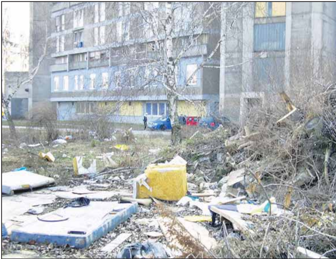
Povyhadzovaný nábytok a iný neporiadok, aj tak to vyzerá vedľa obytných domov.

Kto nebude mať šťastie v našej súťaži, môže si vstupenku v cene 12 € kúpiť priamo na mieste prezentácie Burgenlandu - 14. apríla 2011 v hoteli Radisson Blu Carlton. (brn)