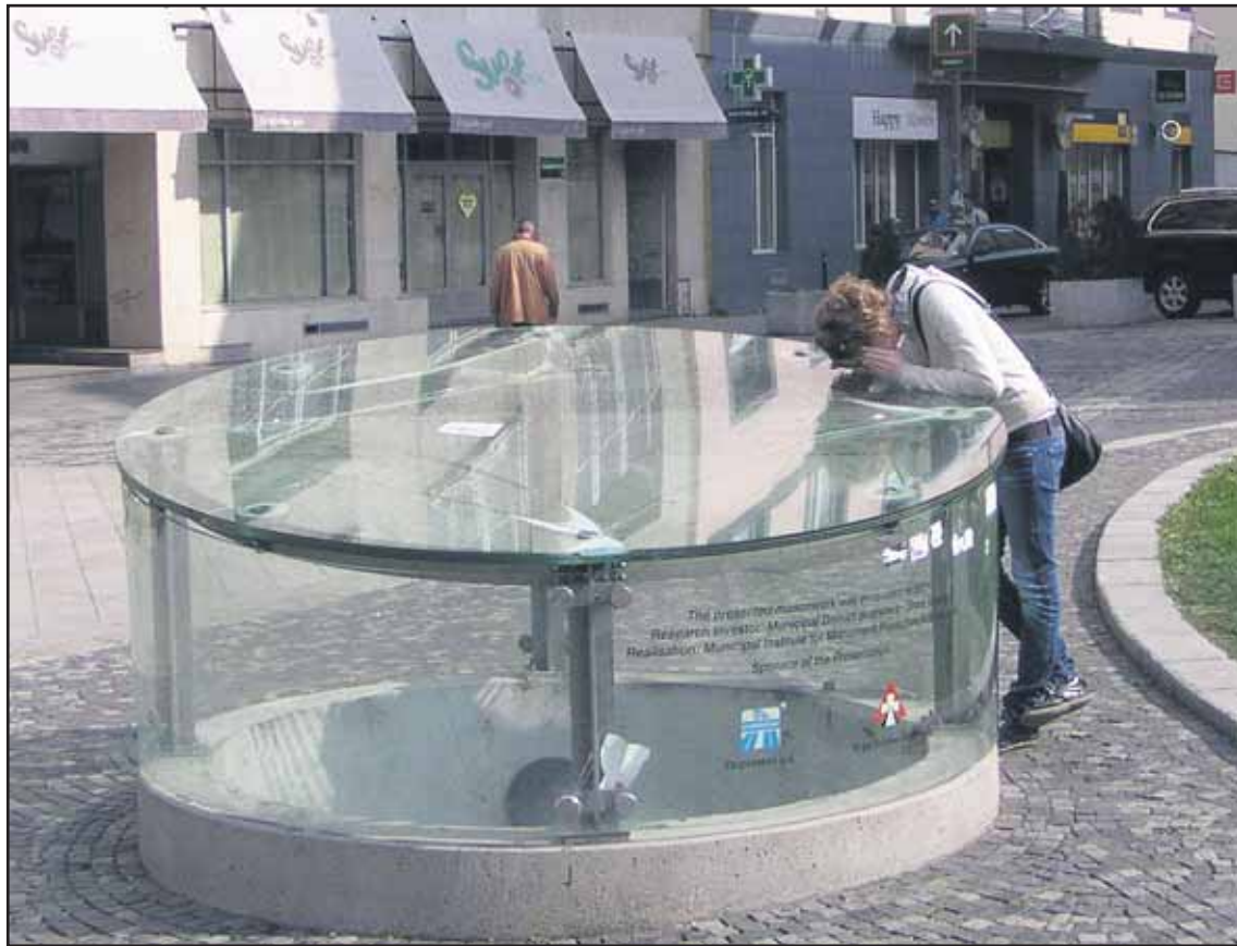
Bratislava má v centre turistický objekt, ku ktorému sa nikto nehlási.

Má spolupracovať na tvorbe územno-plánovacích podkladov, vstupovať do prípravy územného plánu mesta. Jeho úlohou bude aj zabezpečiť vypracovanie záväzných stanovísk magistrátu k investičnej činnosti. (rob)