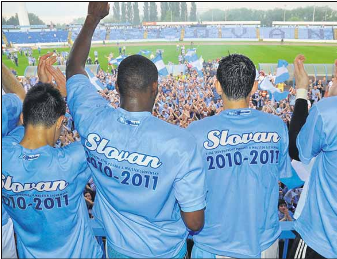
Prvá časť slovanistických osláv majstrovského titulu sa začala už na ihrisku.

KÚŽP zdôvodnil rozhodnutie o zamedzení prístupu k čunovským jazerám tým, že vraj dochádzalo k ničeniu vzácnych porastov na brehu jazier - rozbor vody na konci sezóny ukázal zvýšený obsah opaľovacích olejov v jazerách. Ďalej zakrmovaním rýb, ktoré spôsobuje zvýšenú eutrofizáciu vôd, čo znamená nadmerný rast rastlín a rias vo vodách s vysokým obsahom živín, najmä dusíka a fosforu. (rob)