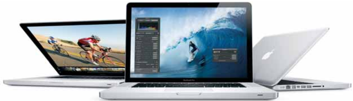
Nový 13-palcový, 15-palcový a 17-palcový MacBook Pro

Najrýchlejší MacBook je teraz až dvakrát rýchlejší. Nový MacBook Pro využíva najmodernejšie procesory Intel a absolútne novú grafiku, ktorá úplne mení pravidlá hry. Unikátne vysokorýchlostné V/V rozhranie Thunderbolt umožňuje jednoducho pripojiť displej s vysokým rozlíšením a špičkové dátové zariadenia pomocou jediného portu. Navštívte predajne Apple a zažite nevídanú silu nového MacBook Pro.