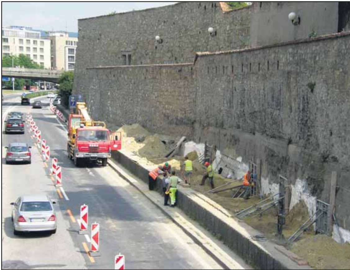
Na múre zatiaľ označujú, kadiaľ povedie vchod do podzemnej garáže.

Druhým projektom, ktorý budú ministerstvo, župa a mesto podporovať je zahustenie zastávok na bratislavských tratiach železnice. Projekt je už vo výstavbe a mal by byť dokončený v roku 2014. Až tretím mieste sa ocitol projekt výstavby koľajovej dráhy z centra mesta do Petržalky. Začiatok výstavby je plánovaný na rok 2013, pričom najskôr bude zrekonštruovaný Starý most a vybudovaná trať na Bosákovú. Druhá etapa - predĺženie trate do Janikovho dvora - má byť v rokoch 2014-2015. (brn)