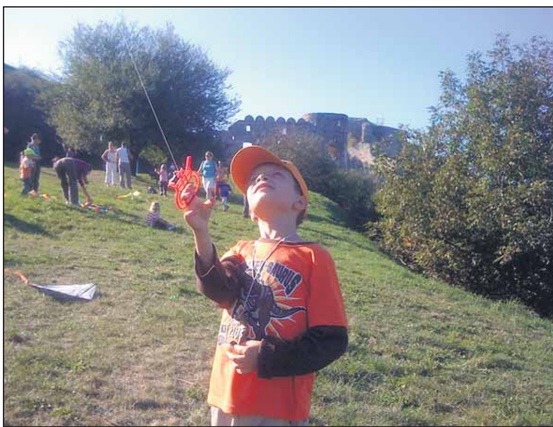
Sobotné púšťanie šarkanov v Devíne bola zábavou pre malých aj veľkých.