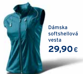
Dámska softshellová vesta 29,90 €