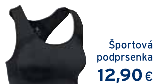
Športová podprsenka 12,90 €

Kolekcia vysokofunkčných odevov, obuvi a doplnkov profesionálnej kvality vrátane kolekcie termooblečenia pre šport v akomkoľvek počasí. Uvedené kolekcie sú dostupné v našich obchodoch v nákupných centrách: AUPARK SHOPPING CENTER Bratislava, OC EUROVEA Bratislava, AVION SHOPPING PARK Bratislava, AUPARK SHOPPING CENTER Žilina a OC OPTIMA Košice.