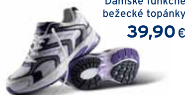
Dámske funkčné bežecké topánky 39,90 €

Vyhliadka na budúci týždeň: Kolekcia dámskej módy „Krásy jesene“