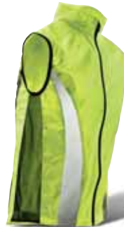
Reflexná športová vesta 19,90 €