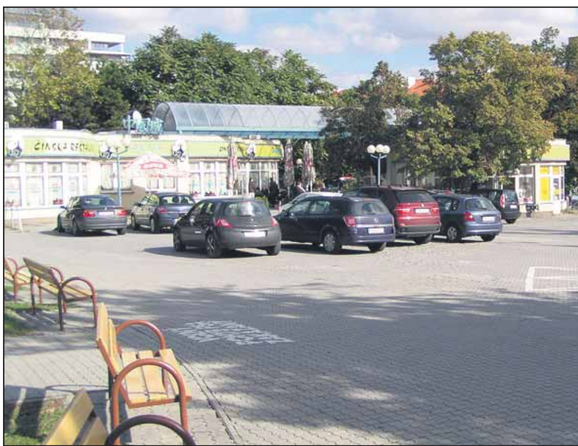
Chodník pri Račianskom mýte sa mení na parkovisko, kde chodci len prechádzajú!

Keďže poslanecký klub SDKÚ-DS výsledky výberových konaní spochybňuje, je pravdepodobné, že primátorove návrhy vo štvrtok na rokovaní zastupiteľstva neprejdú. (brn)