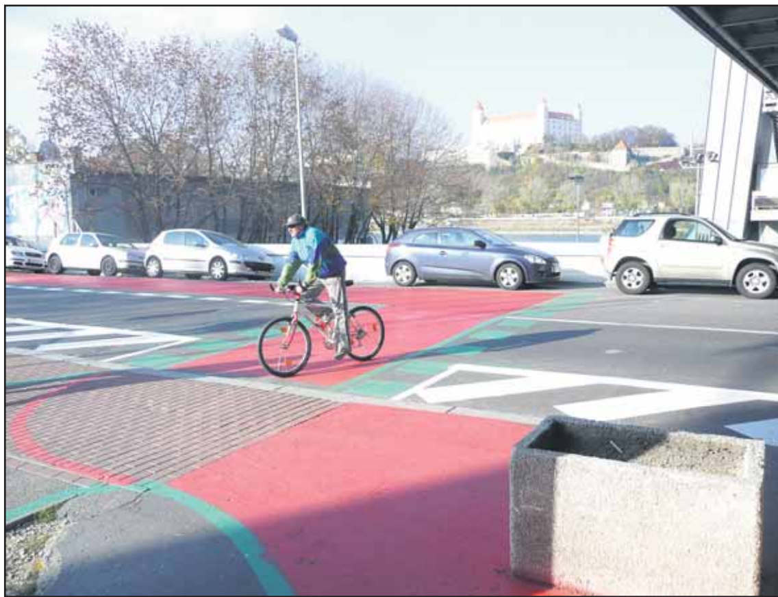
Nové dopravné značenie na Viedenskej ceste vymedzí, kadiaľ môžu jazdiť autá a cyklisti.

Bratislavčanov na budúci týždeň čaká ďalší sviatok mladého vína, tentoraz Svätokatarinského. Pôjde o prvú ochutnávku mladých slovenských vín pod novou značkou Svätokatarinske víno. Buďe na svätú Katarínu - v piatok 25. novembra a v sobotu 26. novembra 2011 na Primaciálnom námestí. Na Svätokatarinskej koštovke budú vína dvoch desiatok slovenských vinárov. (ado)