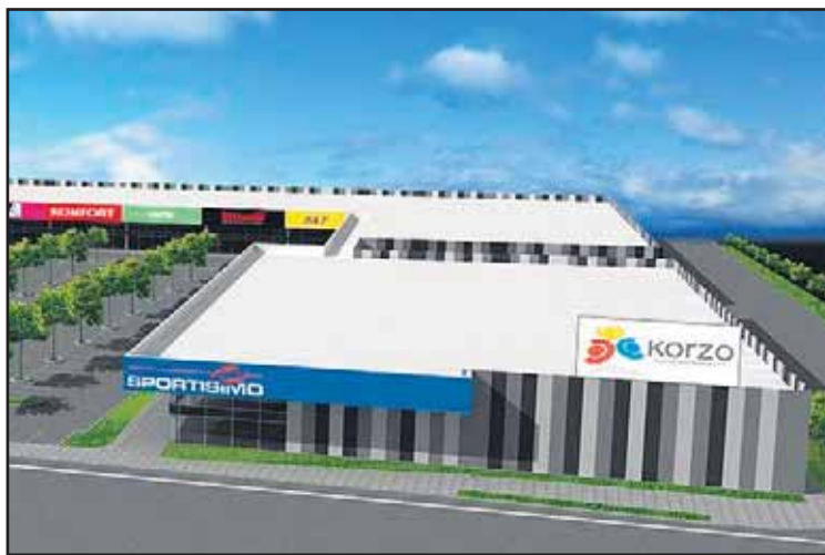
Nákupné centrum KORZO má byť dokončené ešte tento rok.