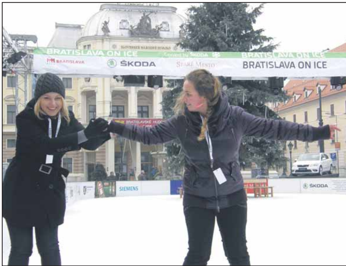
Pred Národným divadlom sa dá opäť korčuľovať na skutočnom ľade.

BRATISLAVA Tohtoročná vianočná kvapka bude v piatok 9. decembra 2011 od 7.45 h v mezaníne Primaciálneho paláca a aj tento rok oslovila nielen zamestnancov samosprávy, ale aj známe bratislavské osobnosti. Účasť prisľúbili bratia Hochschornorovci, Dominik Hrbatý, Filip Šebo, Ján Kroner, Richard Stanke či Iveta Malachovská. Magistrát sú spoločne s Národnou transfúznou službou pripravení prijať takmer stovku dobrovoľných darcov krvi, pričom pre každého darcu je prichystané prekvapenie. (brn)