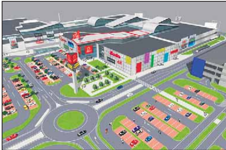
S rozšírením nákupných centier IKEA a AVION sa počíta na budúci rok.