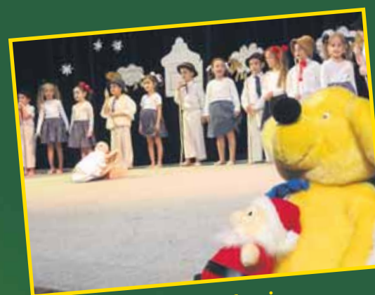
Daruj hračku kamarátovi Rozprávkový a kultúrny program pre deti zo sociálne slabších rodín v DK Lúky