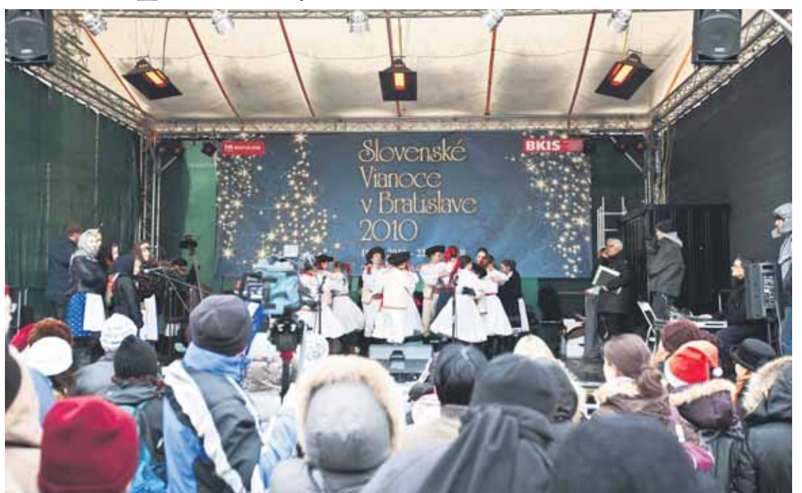
Pred týmto pódium na Hlavnom námestí, ktoré je srdcom bratislavských vianočných trhov, budeme 17. decembra spoločne spievať najobľúbenejšie vianočné piesne.

Na vianočnom námestí zaznejú tie najobľúbenejšie vianočné hity. Okrem iného aj tie, o ktorých sa rozhodne v celoslovenskom hlasovaní na stránke Pluska.sk Celoslovenskú anketu aj podujatie Spievajúce vianočné námestie zorganizovala spoločnosť Orange.