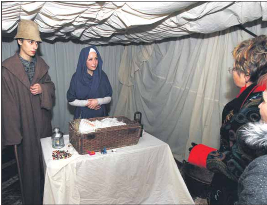
Živý Betlehem bude na nádvorí Zichyho paláca opäť v nedeľu 18. decembra 2011.

„O 3,5 milióna eur redukovaný rozpočet teda bude znamenať, že mesto nebude schopné uhradiť výkony, ktoré si plánuje objednať. Pre DPB okrem prehlbovania straty z toho môžu vyplynúť ďalšie redukčné opatrenia, ktoré sa dotknú najmä cestujúcej verejnosti. Plánovaných viac ako 45 miliónov vozokilometrov bude nevyhnutné výrazne redukovať a zvyšovanie kvality a komfortu cestovania preto nemožno predpokladať,“ tvrdí generálny riaditeľ DPB. (brn)