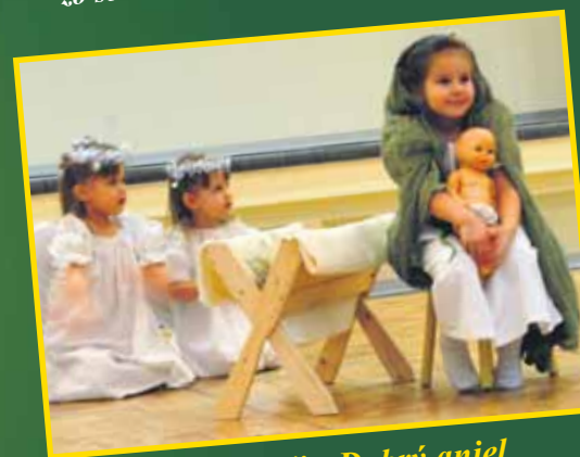
Sme iní, sme Vaši - Dobrý anjel Výstava diel autistických detí z materskej školy na Il'jušinovej a zdravých detí z Centra voľného času na Gessayovej ulici v budove Technopolu