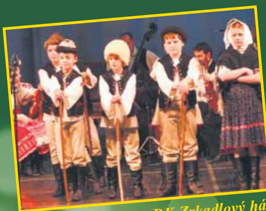
Vianočný koncert v DK Zrkadlový háj Autentický folklór s vianočnými koledami