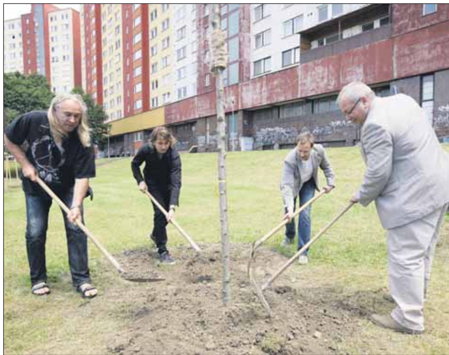
V predchádzajúcom ročníku sa z novej zelene tešili aj obyvatelia bratislavskej Petržalky. S výsadbou nových stromov na sídlisku im pomáhali aj známi Petržalčania.

ste zákazníkom Orangeu, stačí si aktivovať elektronickú faktúru, alebo odnieť na predajné miesto starý mobil, ktorý už nepoužívate. Za každú z týchto jednoduchých aktivít získavate pre svoje mesto či obec bod. Na každé zo šiestich víťazných miest čaká až 3300 eur na výsadbu novej zelene. Víťazmi sa stanú po dve mestá, respektíve obce na západe, východe a v strede Slovenska – vždy jedno s počtom obyvateľov nad 15-tisíc a jedno, kde žije do 15-tisíc obyvateľov. Minulý rok najviac ekologických aktivít urobili obyvatelia Galanty, Námestova, Krompách, Košíc, Banskej Bystrice a bratislavskej Petržalky. Práve oni sa potom mohli tešiť z nových stromov a kríkov, ktoré vyrástli na miestach, kde predtým najviac chýbali. Rozhodli ste sa zabojovať o ďalší zelený kúsok pre vaše mesto alebo obec? Bližšie informácie a pravidlá, ako sa zapojiť do ekologickej súťaže Zeleň pre mesto, nájdete na www.orange.sk/zelen .