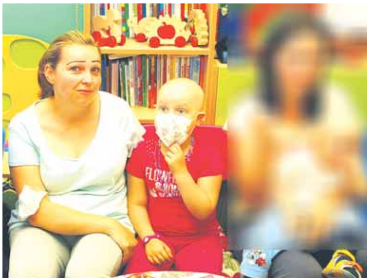
Z vyzbieraných peňazí budú opäť uhradené spoločné regeneračno - rekondičné pobyty pre rodiny onkologicky chorých detí.

Súčasťou projektu sa môžete stať aj VY! Stačí sa pripojiť k pelotónu na akejkoľvek trase a absolvovať na bicykli akúkoľvek vzdialenosť. Okrem stálych účastníkov pelotónu sa do akcie na bicykli môže zapojiť aj širšia verejnosť v regiónoch, ktorými bude túra prechádzať. Projekt môže verejnosť podporiť aj finančne na číslo účtu: 0634024952/0900.