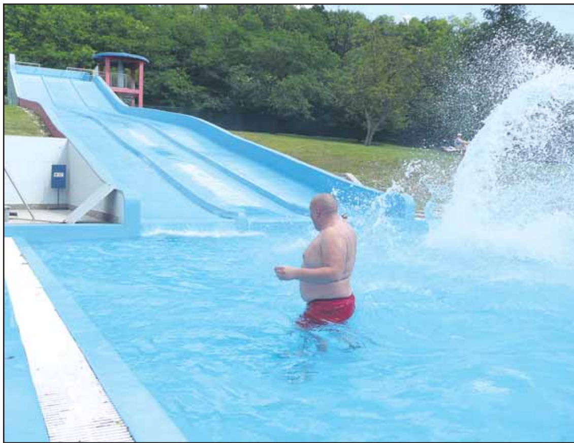
Počas prvého víkendy si cestu na bratislavské kúpaliská našli len tí najotužilejší.