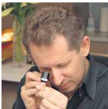
Odborníci z Goldparty preskúmajú a zhodnotia vaše zlaté šperky okamžite.