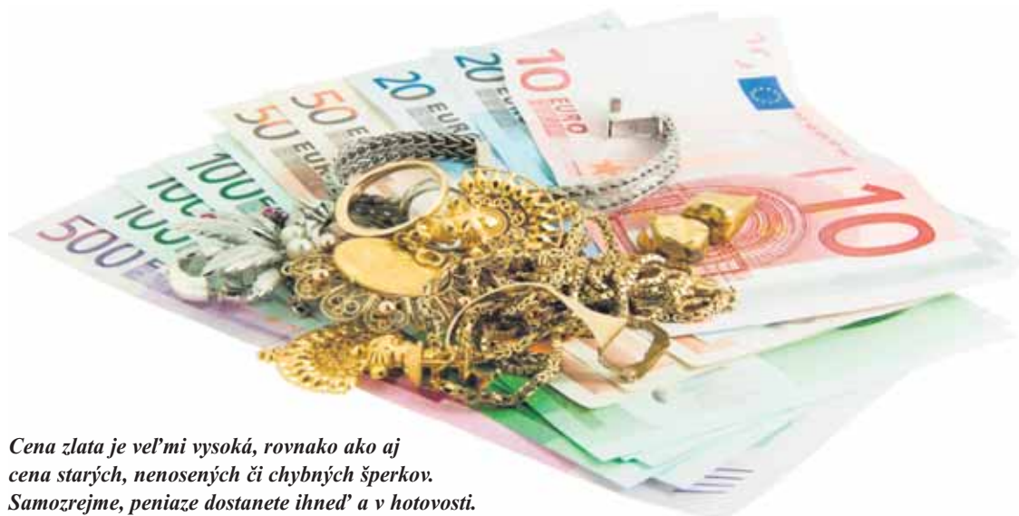
Cena zlata je veľmi vysoká, rovnako ako aj cena starých, nenosených či chybných šperkov. Samozrejme, peniaze dostanete ihneď a v hotovosti.