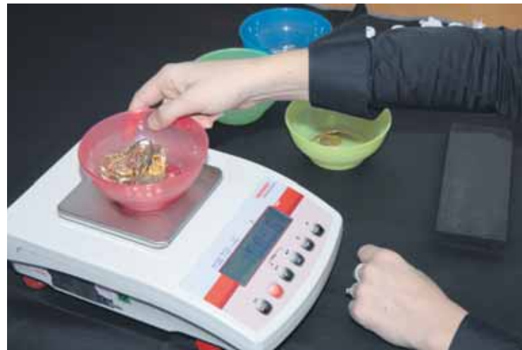
Nákup zlata si vyžaduje presnosť. Goldparty pracuje výhradne so značkovými a kalibrovanými váhami.