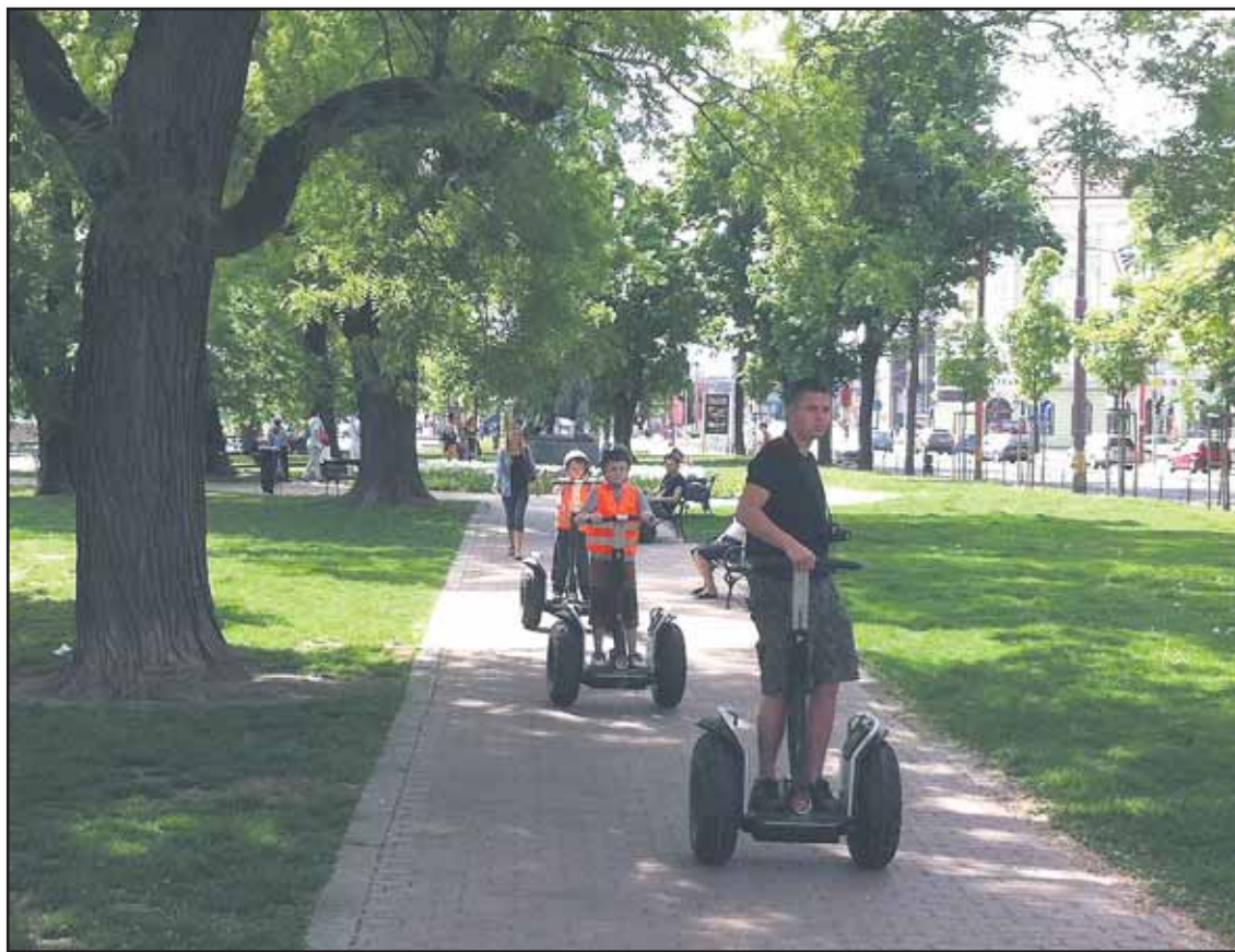
Maloletých jazdcov naviedol ich sprievodca priamo do parčíka na Vajanského nábreží.

„Čaká nás nový deň, nové výzvy a urobíme všetko pre to, aby bol Slovan úspešnejší než v minulom ročníku. Pri dobrých výsledkoch sa vráti aj fanúšik. Sú to spojené nádoby, bez divákov sa futbal nedá hrať. Nasadením v príprave, ako i zmenami v kádri chceme dosiahnuť návrat priaznivcov na tribúnu. Celé je to podmienené dobrou hrou,“ povedal Vladimír Weiss. (sks)