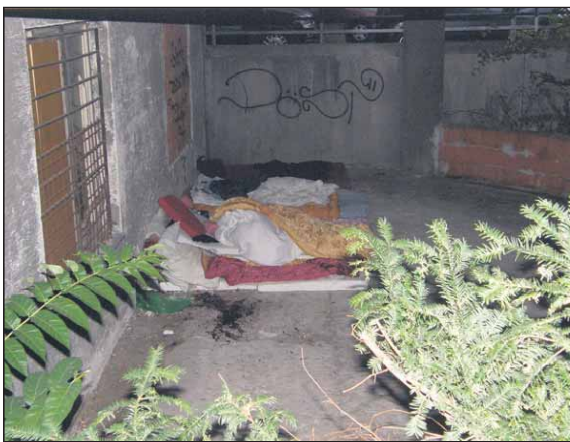
Na rohu ulíc Bezručova a Dobrovičova prespávajú v areáli bývalej polikliniky bezdomovci.

Od štvrtka 25. októbra až do štvrtka 8. novembra 2012 tak budú všetky bratislavské cintoríny otvorené denne od 7.00 do 20.00 h. V tomto ročnom období, keď sa skraca deň, skraca sa aj záverečná hodina na cintorínoch. V októbri sú cintoríny otvorené do 19.00 h, v novembri, decembri, januári a vo februári až len do 18.00 h. Výnimkou sú práve dušičky, keď sa dočasne otváracie hodiny predlžujú. (brn)