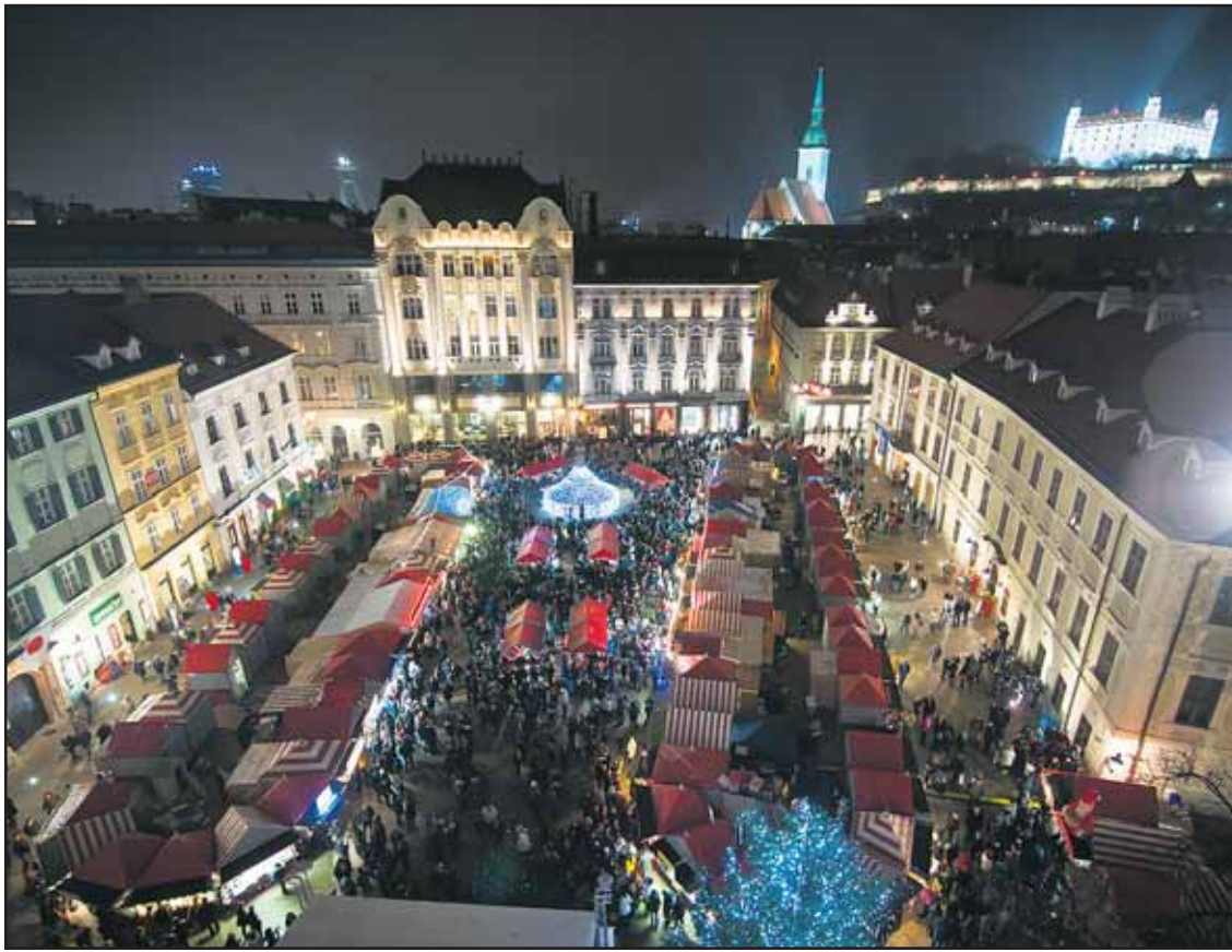
Vianočné trhy na Hlavnom námestí potrvajú až do nedele 23. decembra 2012.

Stará tržnica by jednoznačne mala byť opäť verejným priestorom a mala slúžiť obyvateľom mesta. Pokiaľ ju nedokáže oživiť samospráva mesta, je to dôkaz o jej neschopnosti. Ak si na to trúfajú občianske združenia, malo by to zvládnuť aj vedenie hlavného mesta. (ado)