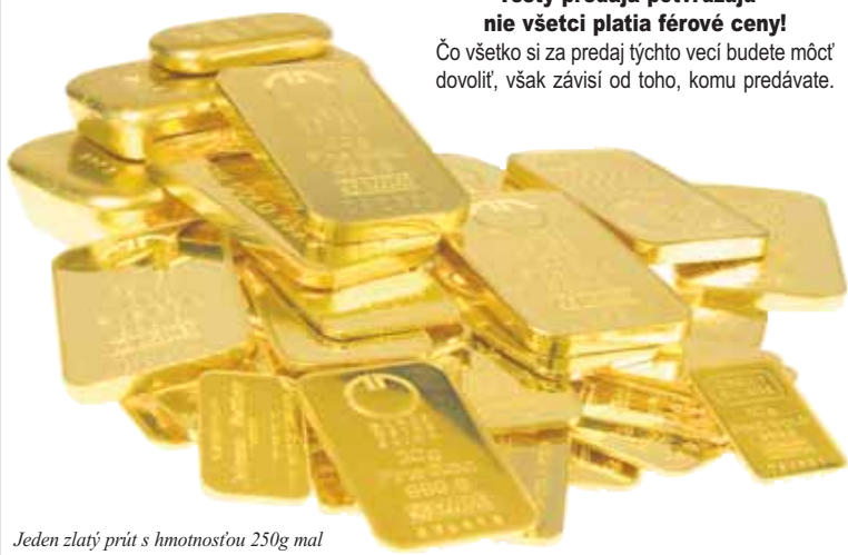
Jeden zlatý prút s hmotnosťou 250g mal pred 10 rokmi hodnotu 2500 eur – dnes stojí viac ako 10 500 eur!

GoldParty je tu pre Vás – 10. a 12. decembra 2012 v CityHotel Bratislava (bývalý Hotel Bratislava) na Seberínho ulici 9, Bratislava - Ružinov. Informácie nájdete aj na: http://www.goldparty.at/vykup-zlata-bratislava.html alebo info@goldparty.at