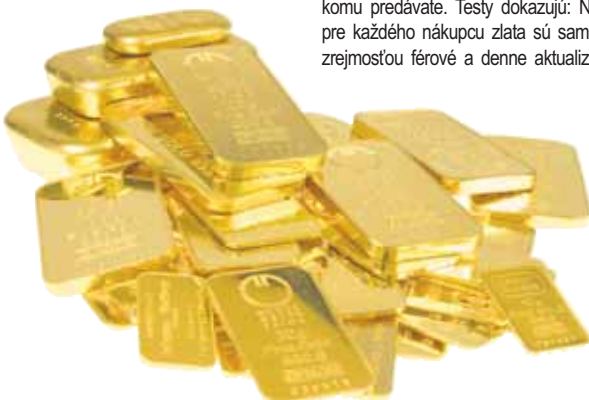
Jeden zlatý prút s hmotnosťou 250g mal pred 10 rokmi hodnotu 2500 eur – dnes stojí viac ako 10 500 eur!

Informácie nájdete aj na: http://www.goldparty.at/vykup-zlata-bratislava.html alebo info@goldparty.at