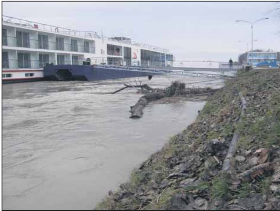
Na bratislavskom úseku dosiahla hladina Dunaja 695 cm.

A ešte s jednou novinkou začíname rok 2013. Bratislavské noviny zvyšujú náklad na 212-tisíc kusov. Náš poštový operátor eviduje o 4000 viac poštových schránok - niektoré pribudli vďaka novej výstavbe, ďalšie boli pre doručovateľov nedobytné. Takže v novom roku veľa šťastia Bratislave, Bratislavčanom a ich Bratislavským novinám. Radoslav Števčík