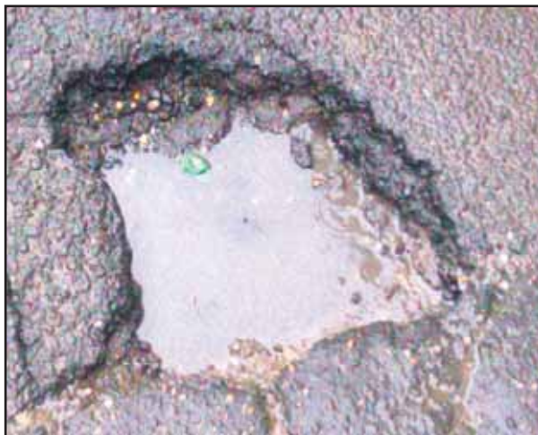
Takto vyzerá jama na Lermontovovej ulici, akých je v Bratislave neúrekom.

A tak by sme si chceli dať záväzok za všetkých zodpovedných. Za bratislavský magistrát a mestské časti - už teraz chceme a zmapujeme všetky výmole a nerovnosti a tie najvypuklejšie opravíme dočasne netechnologickým spôsobom a hneď po stúpnutí teploty nad 10 stupňov