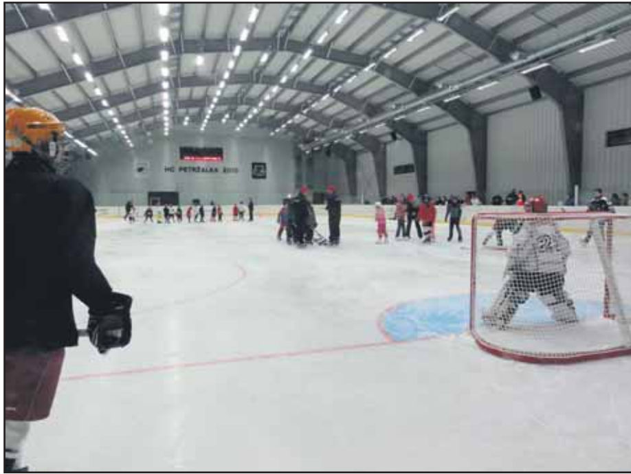
Petržalčania majú svoj prvý zimný štadión, celkovo v Bratislave už piaty.