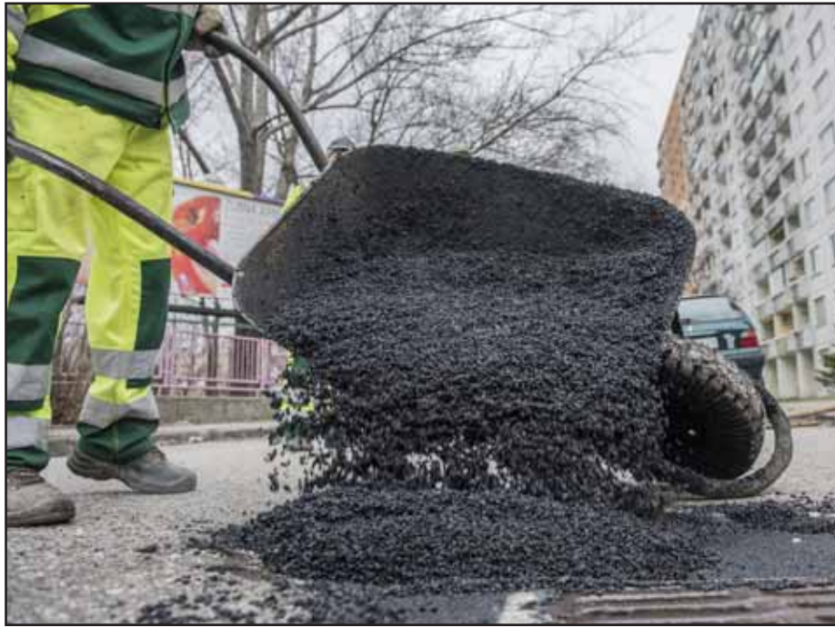
Magistrát zatiaľ na opravu výtlkov minul 60 ton asfaltovej zmesi.