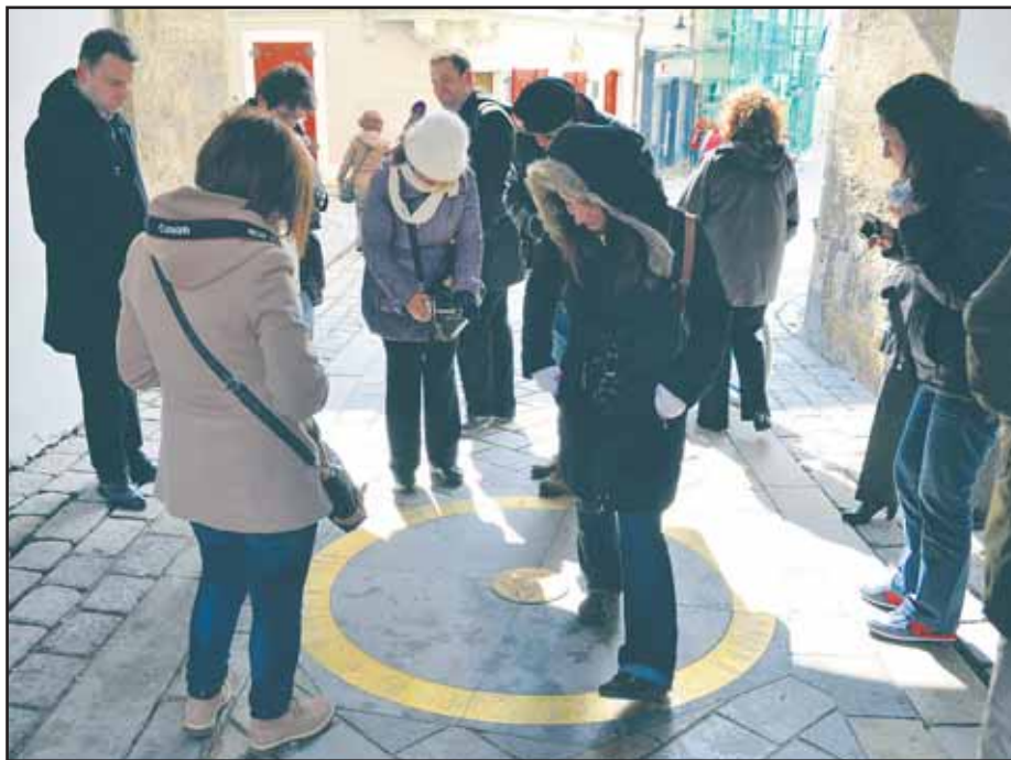
Nultý kilometrovník opäť púta pozornosť Bratislavčanov i turistov.

Z čoho teda žil primátor Bratislavy, keď len na splatenie úveru, pôžičky a kúpu auta minul viac ako zarobil? Z informácií, ktoré sám zverejnil, vyplýva, že mňa viac ako zarába. Možno mu krivdíme a živí ho manželka, alebo sa niekde stala chyba... (ado)