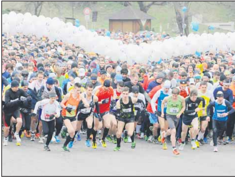
Z Devína do Bratislavy tento rok vybehlo 5843 bežcov a bežkýň.

KDH navrhuje, aby právo vybrať námestníka primátora spomedzi seba mali výlučne poslanci mestského zastupiteľstva. Smer-SD vlni presadil, že námestníkov si vyberá primátor. (brn)