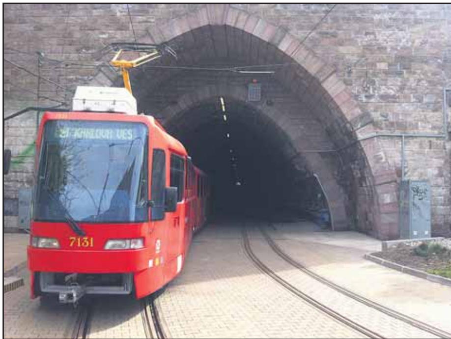
Linky MHD č. 5 a 9 opäť jazdia cez opravený tunel a Kapucínsku ulicu.