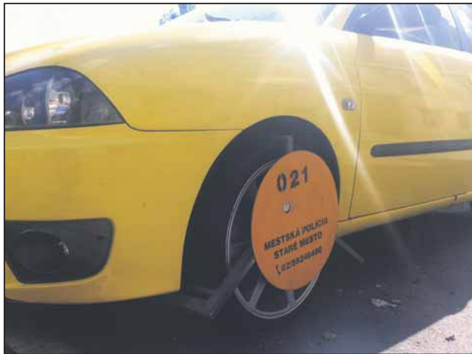
Dovolí zákonodarca fotiť dopravné priestupky aj mestským policajtom?