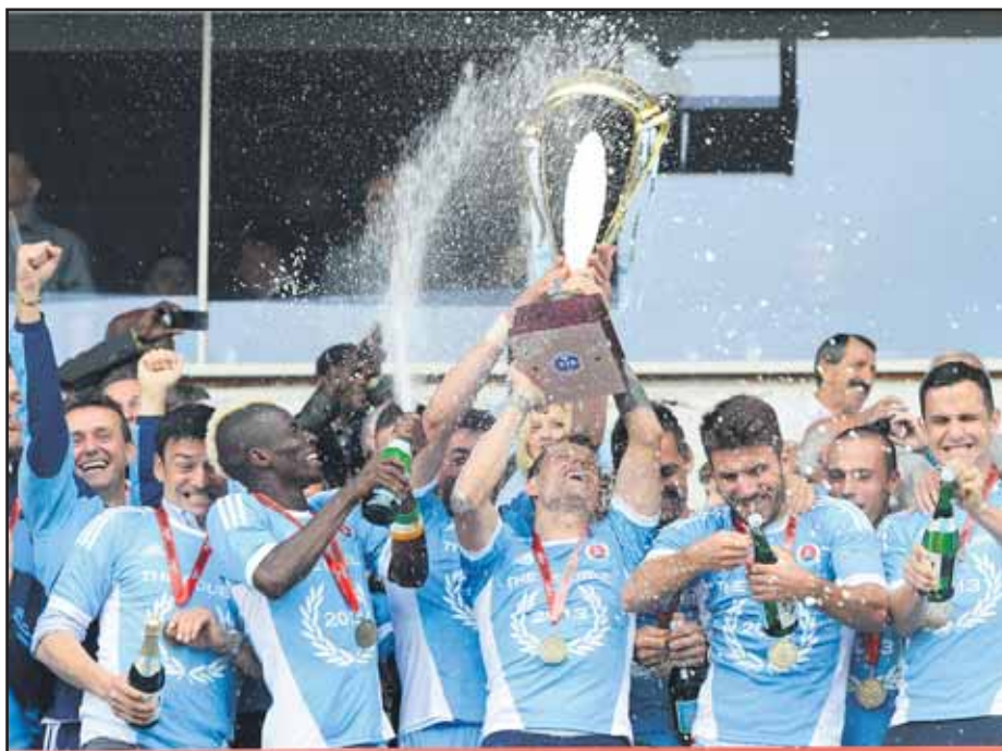
Belasi zdvihli nad hlavu majstrovský pohár už siedmykrát.

Mestský dopravca priznáva, že konanie úradu zdržalo celý proces, ale len minimálne, a súťaž na nákup električiek môže opäť pokračovať. (dpb)