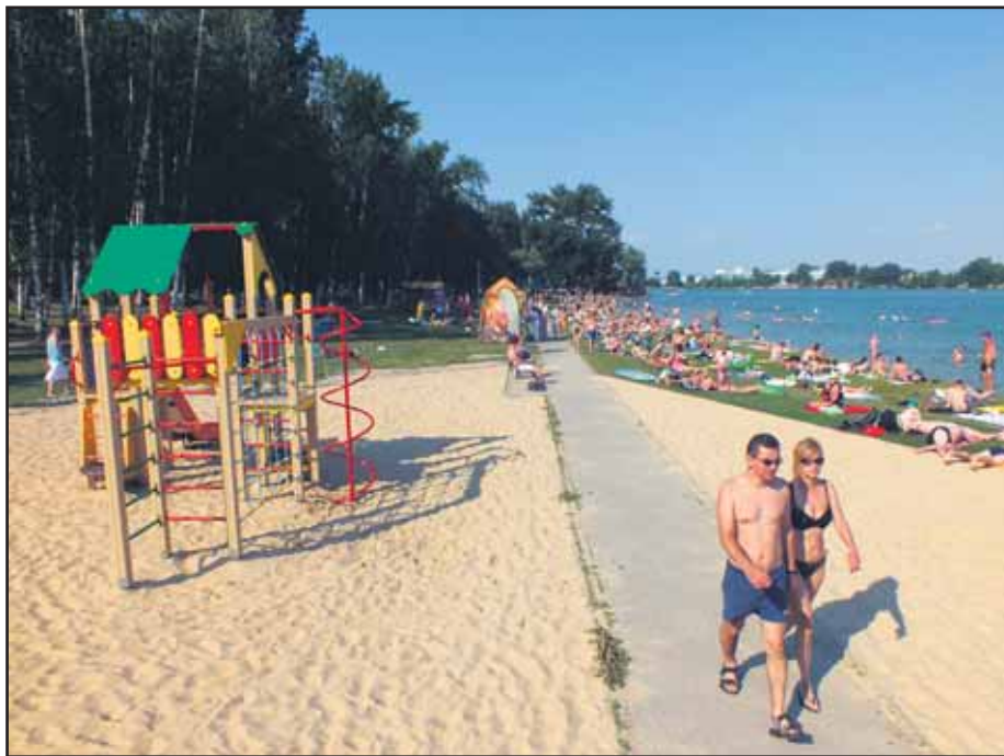
Vynovené Zlaté piesky zostávajú letným kúpaliskom s najnižším vstupným.