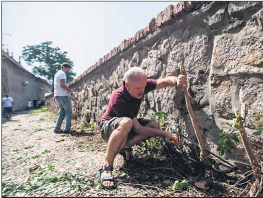
Do čistenia mestských hradieb sa museli pustiť dobrovoľníci...