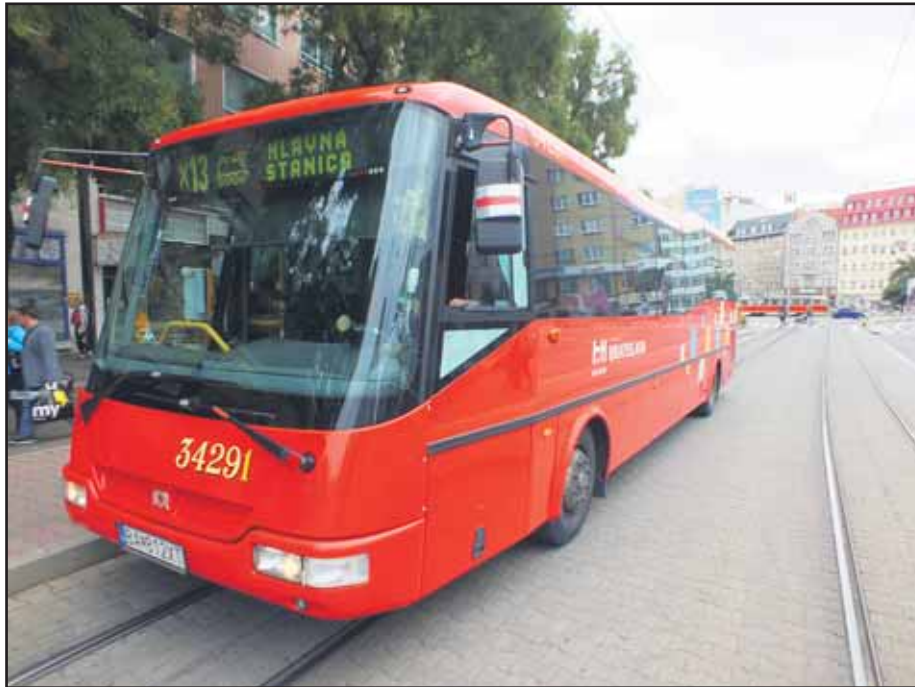
Na tretí pokus jazdí náhradná linka X13 na Hlavnú stanicu jednoduchšou trasou.

Podľa zákona mohol primátor prísť až o mandát, podľa zákona totiž „rozhodnutím sa vysloví strata mandátu alebo strata verejnej funkcie, ak sa v predchádzajúcom konaní proti verejnému funkcionárovi právoplatne rozhodlo, že nespĺnil alebo porušil povinnosť alebo obmedzenie ustanovené týmto ústavným zákonom alebo zákonom, alebo v oznámení uviedol neúplné alebo nepravdivé údaje“. Mestskí poslanci sa zrejme priklonili k právnenému názoru, že „v predchádzajúcom konaní“ znamená, že funkcionár by už raz musel porušiť tento zákon. To sa vo Ftáčnikovom prípade nestalo. (brn)