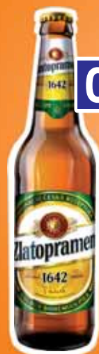
Zlatopramen premióv svetlý ležiak 11%, 0,5 l