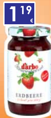
Darbo džem jahodový, nízkokalorický 220g