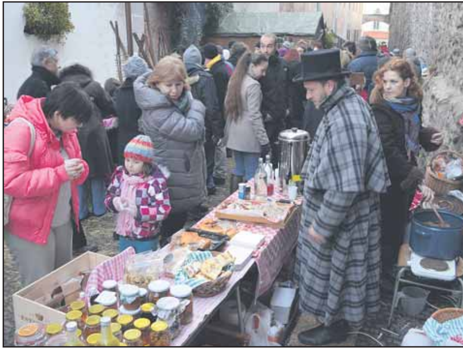
Vianočné trhy na hradbách počas troch dní prilákali najmä Bratislavčanov.

S návrhom rozpočtu na rok 2014 predstúpi primátor pred poslancom 30. januára 2014. (brn)