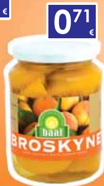
BAAL broskyne polené, lúpané 700g