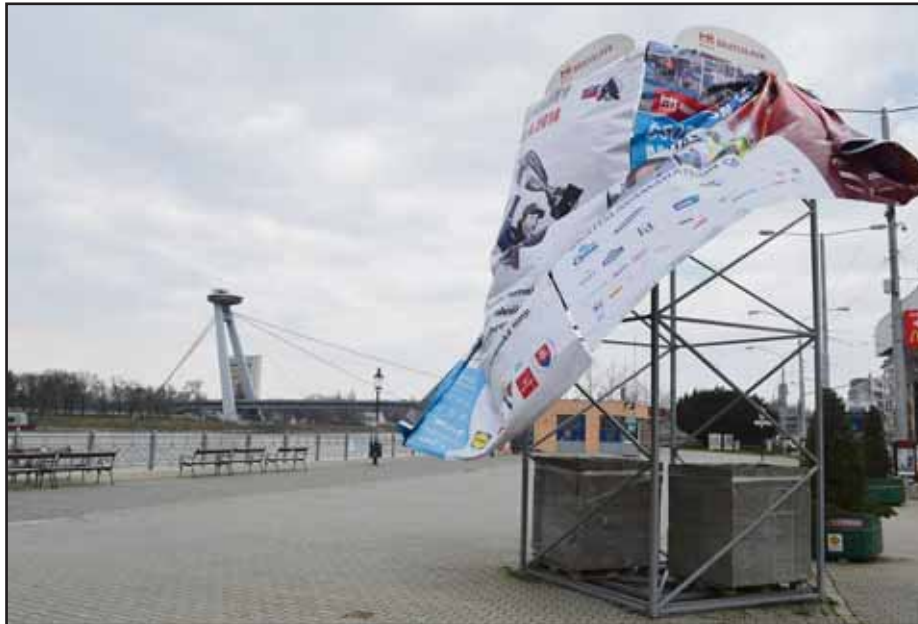
Jedno reklamné zariadenie CITYTOWER je aj na Námestí Ľudovíta Štúra.

Faktom je, že začiatkom roka malo mesto uzatvorené platné nájomné zmluvy k vyše 130 reklamným zariadeniam. Ďalším 458 bilbordom či bigboardom nájom počas posledných troch rokov vypršal. A hoci v minulosti boli oficiálne povolené, mesto zmluvy neobnovilo. Znamená to, že stoja na mestských pozemkoch bez platnej nájomnej zmluvy. (brn)