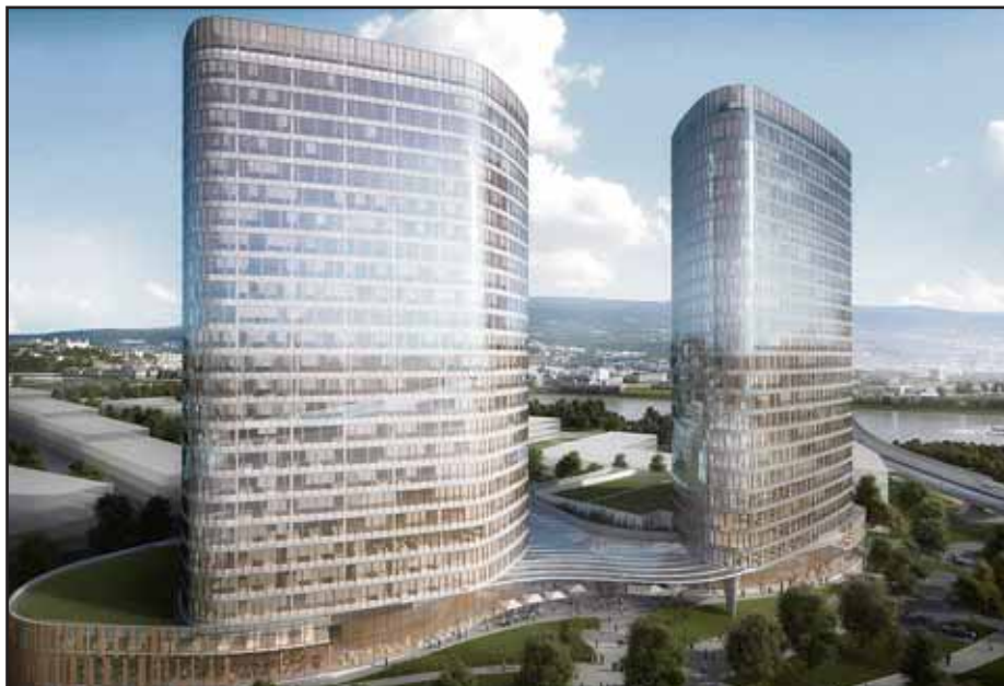
Alfa Park majú tvoriť dve veže, každá bude mať 26 nadzemných podlaží.