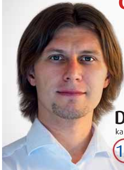
Damián Kováč kandidát do Európarlamentu