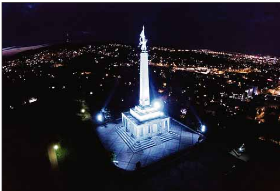
Pamätník Slavín je po rokoch dominantou Bratislavy aj v noci.

Podľa zmluvy z februára 2005 bolo „nájomné stanovené vo výške 1 slovenskej koruny za celé obdobie nájmu“. Nie je však známe, aké navrhuje veľvyslanec nájomné za predĺženie nájmovej zmluvy o 18 mesiacov. (ado)